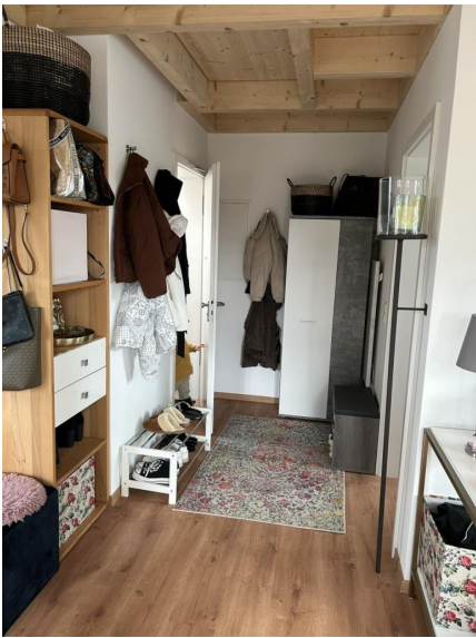
Platz für Garderobe