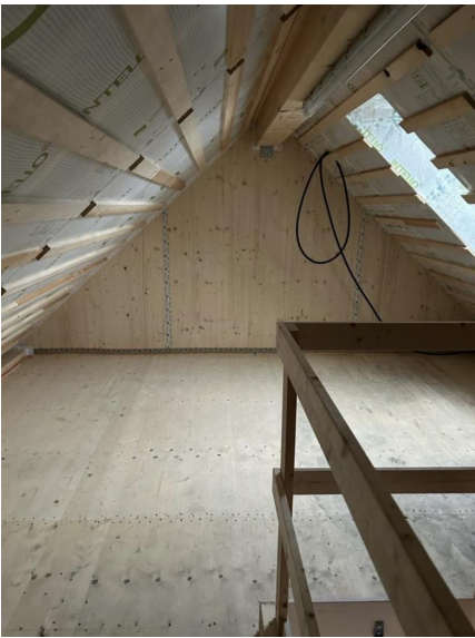
Spitzboden als Lager