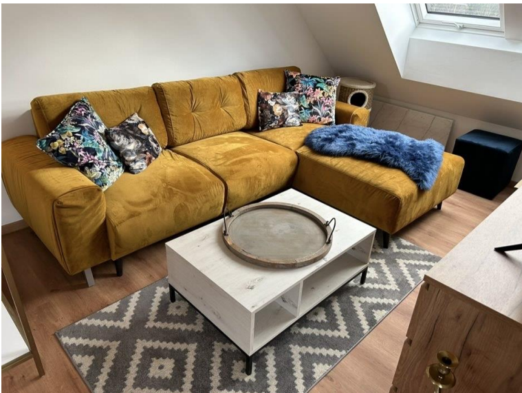
Praktisch - Kompakt