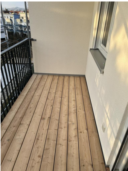
Balkon nach Westen