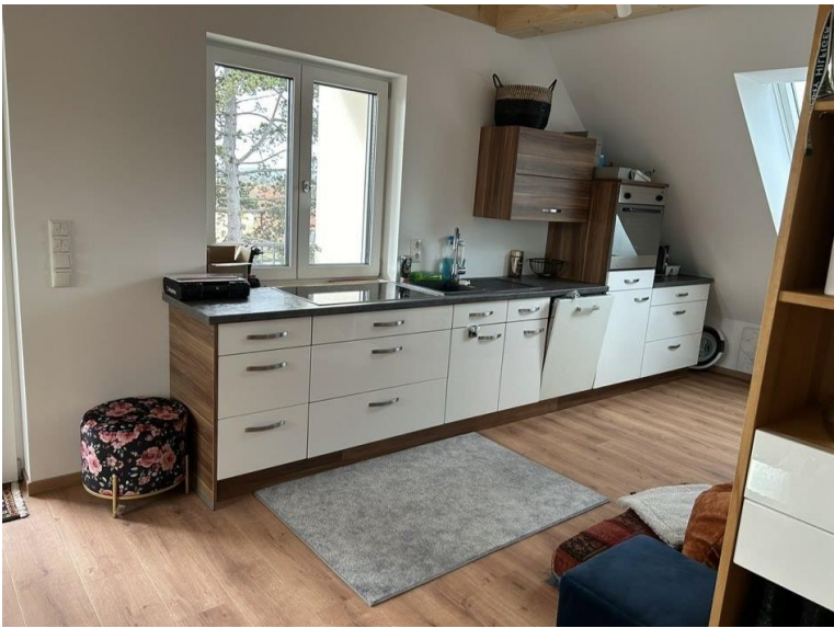
Neuwertig + Günstig