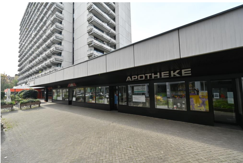
Einkaufen ums Eck