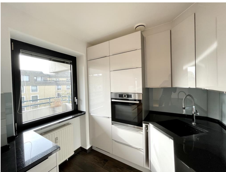
... und neuwertige Küche