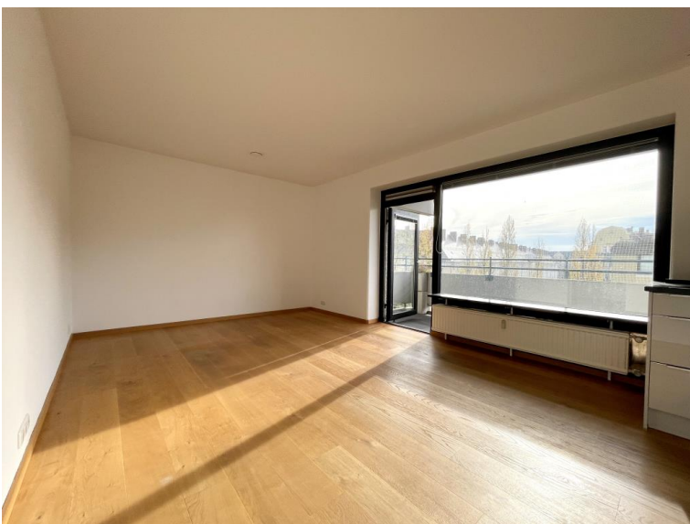
Zugang vom Wohnzimmer