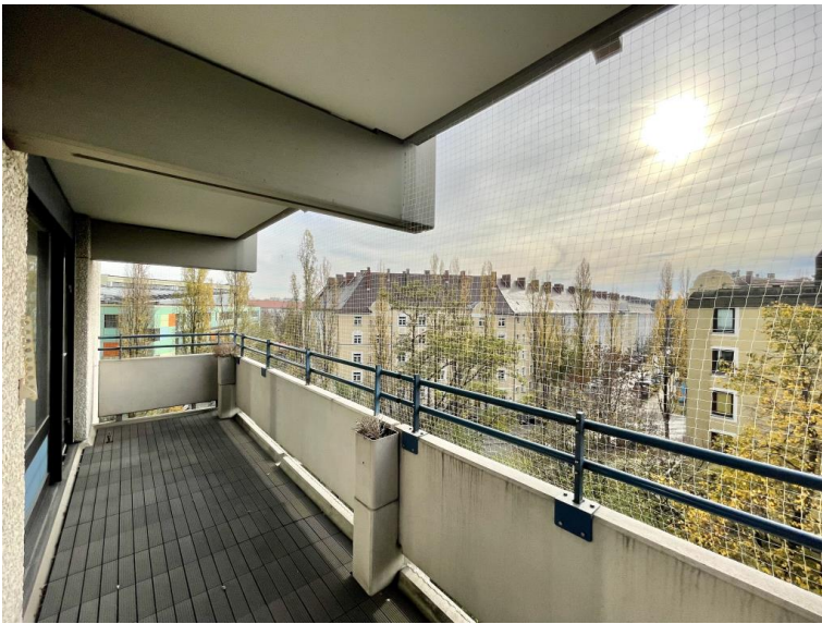
... und geschützter Balkon