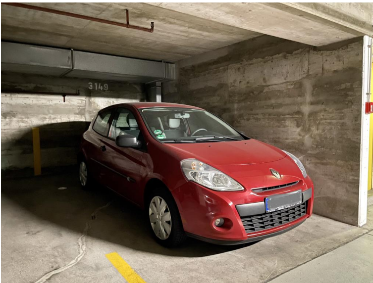
TG-Stellplatz auf Wunsch