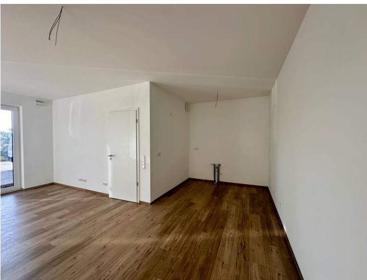
Platz für Küchenzeile