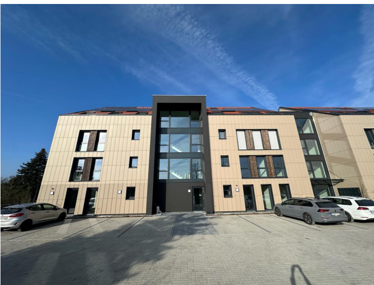
Haus B1 - Erdgeschoss