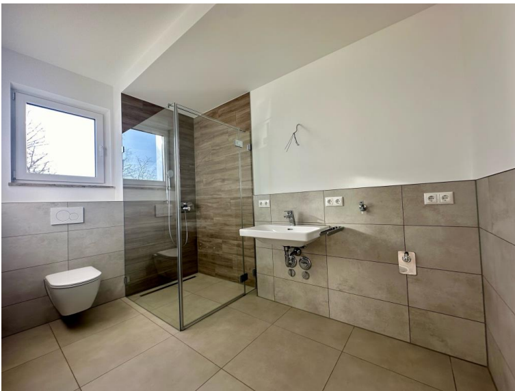
Gäste-WC mit Dusche