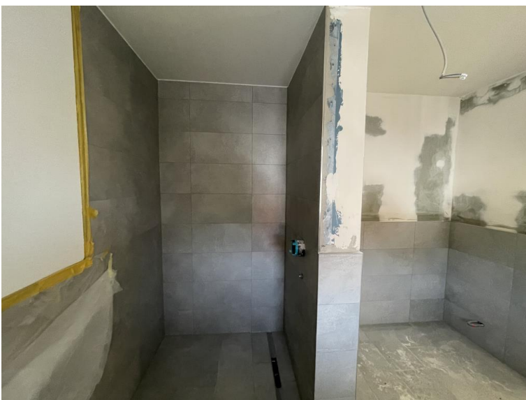
... und viel Platz