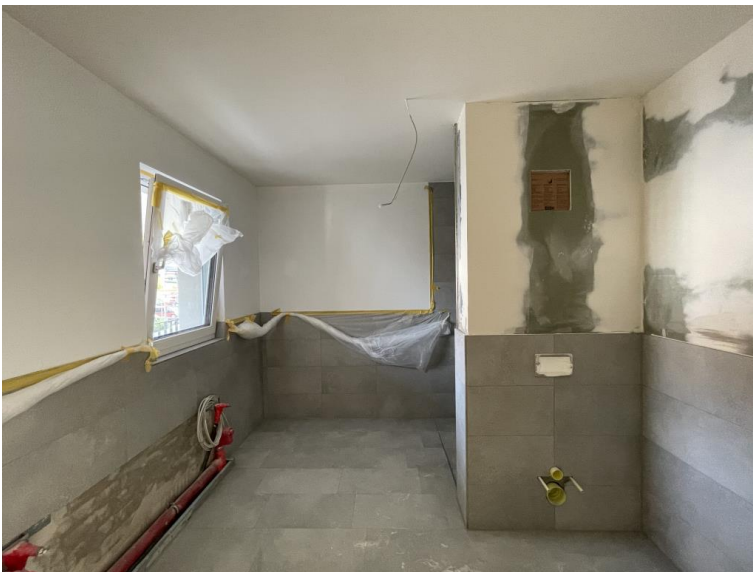
Bad mit Fenster...