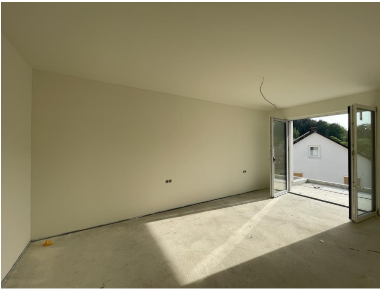
Schlafen mit Balkonzugang