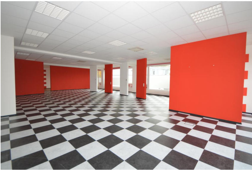
Variable Einteilung möglich