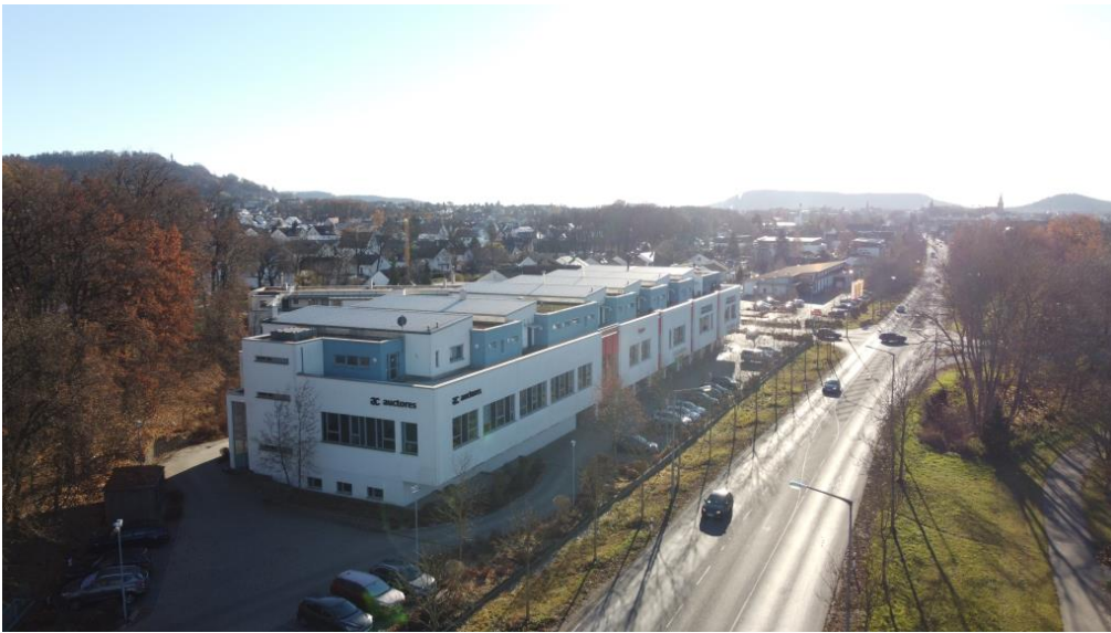
Nähe Zentrum und Autobahn