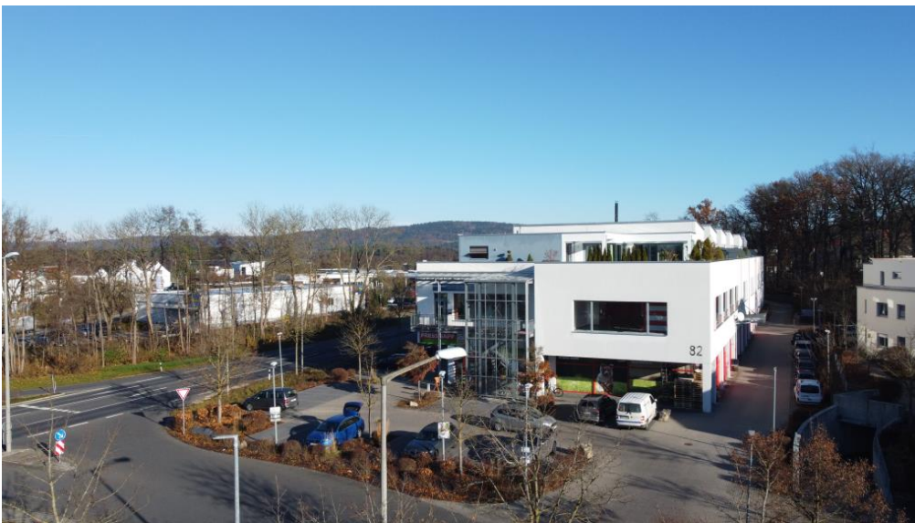
Wohn- und Geschäftszentrum

Energieausweistyp: VERBRAUCH Energieverbrauchskennwert: 50,40