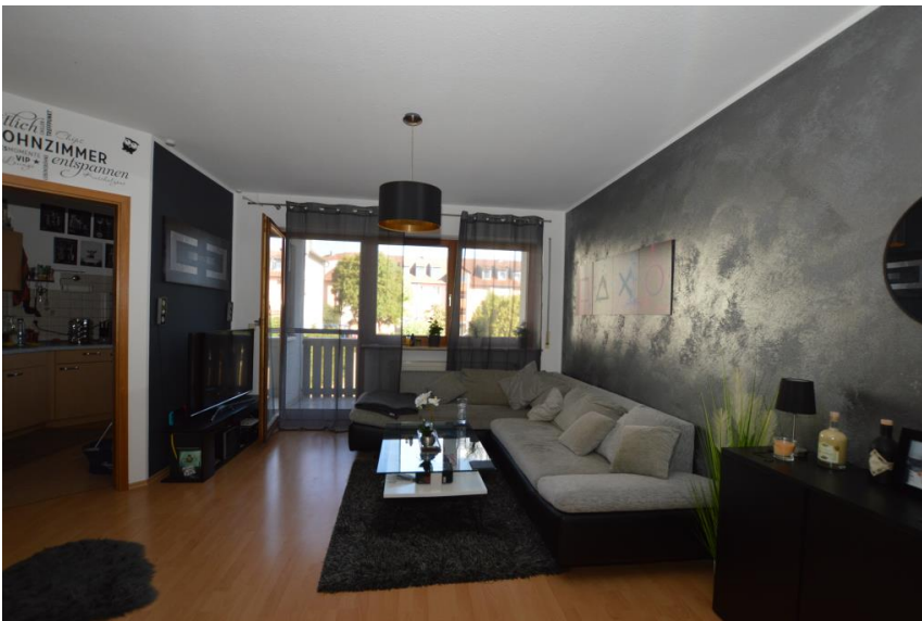
Wohnen mit Balkonzugang