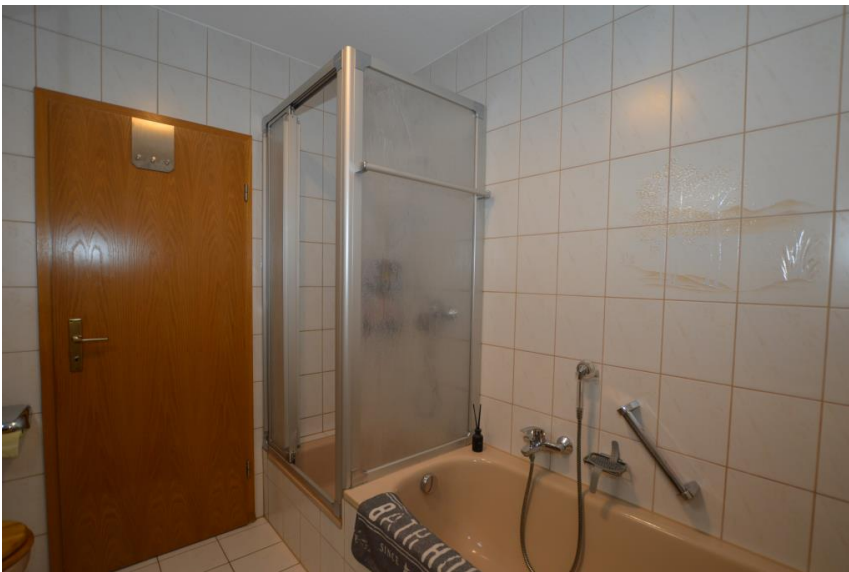
Wanne & Dusche