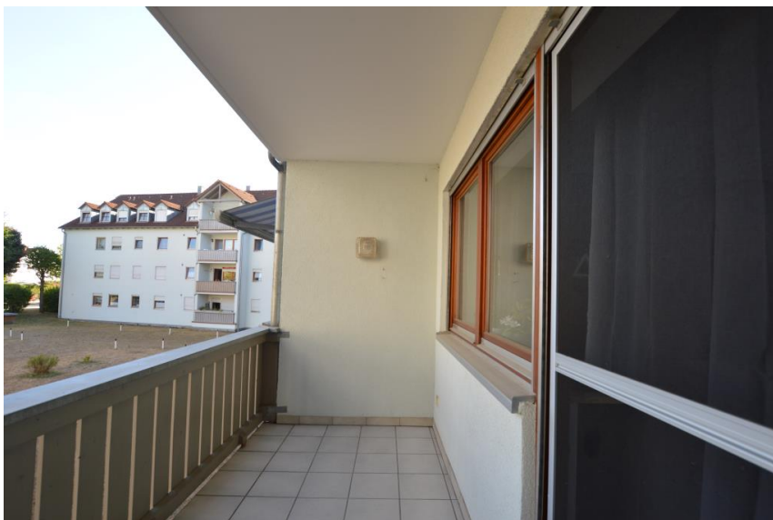
In schöner Größe