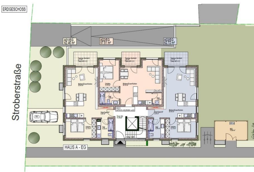
Das Haus A