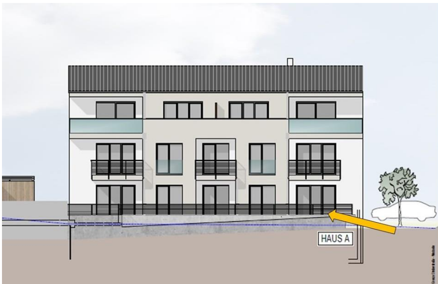
Haus A - Wohnung A01