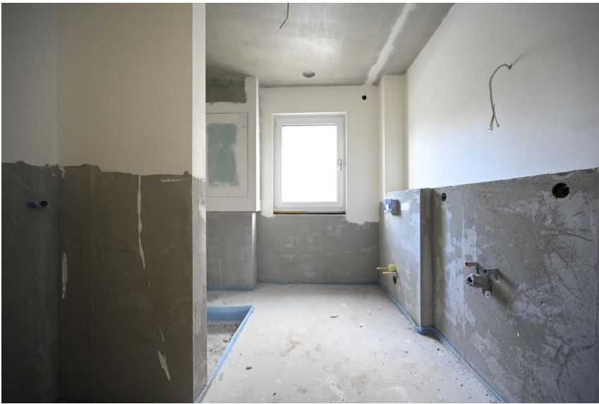
Voll ausgestattetes Bad