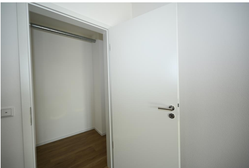
Abstellraum nah an der Küche