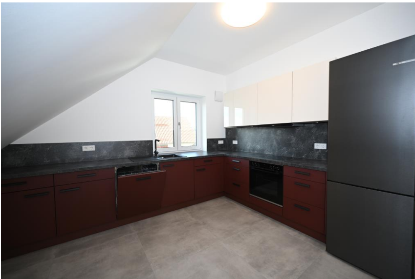
NEUE Einbauküche inklusive