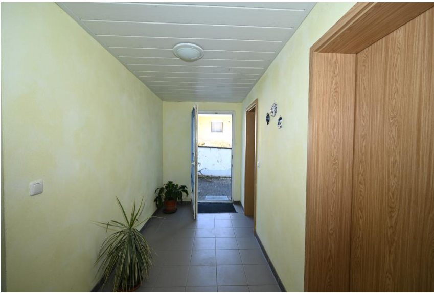
Zugang zur Wohnung