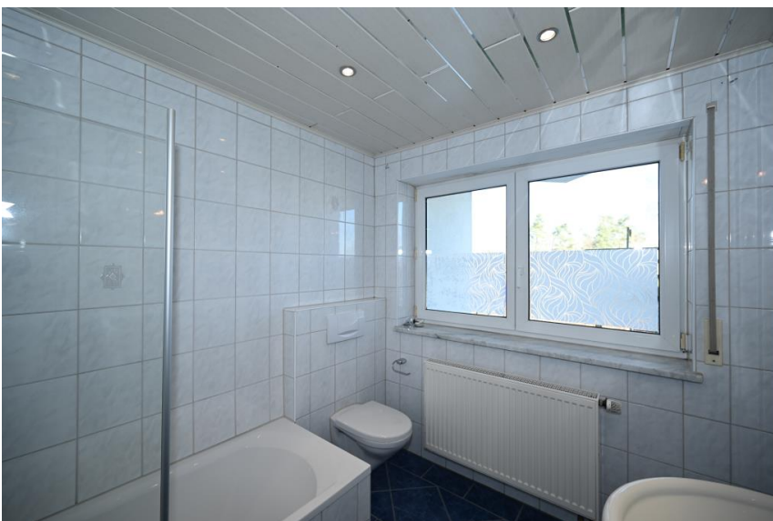
Wanne & Fenster