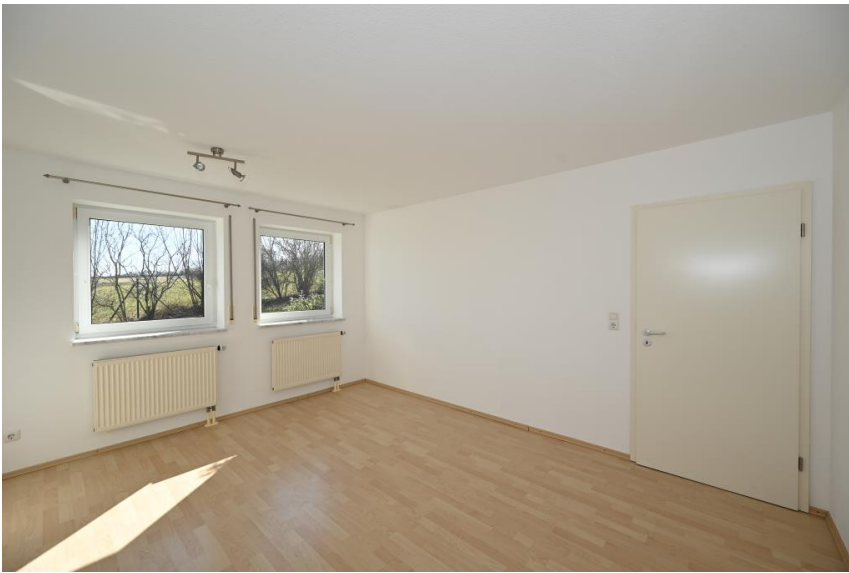
Gut zu möblieren