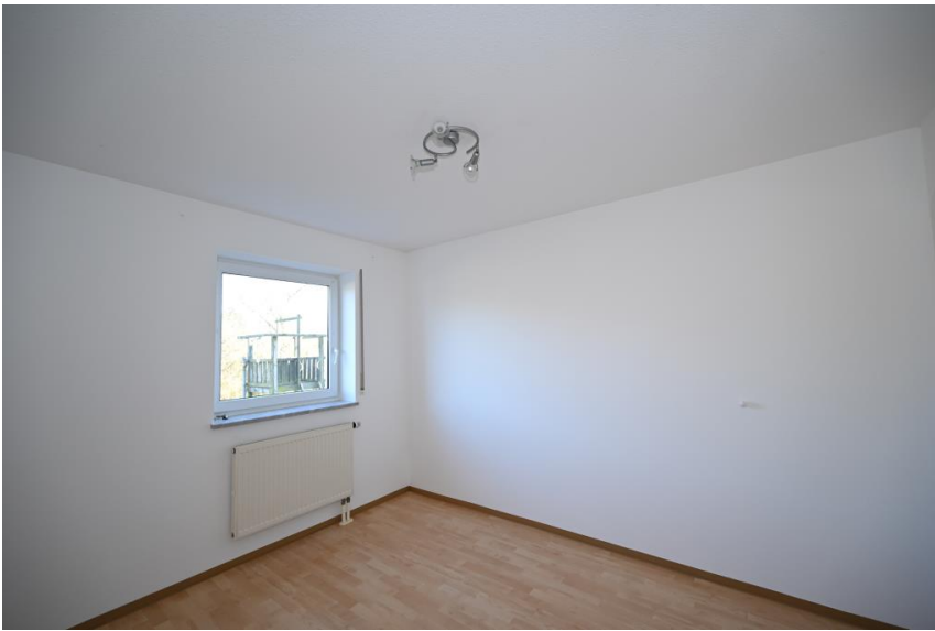
Perfekt für Singles