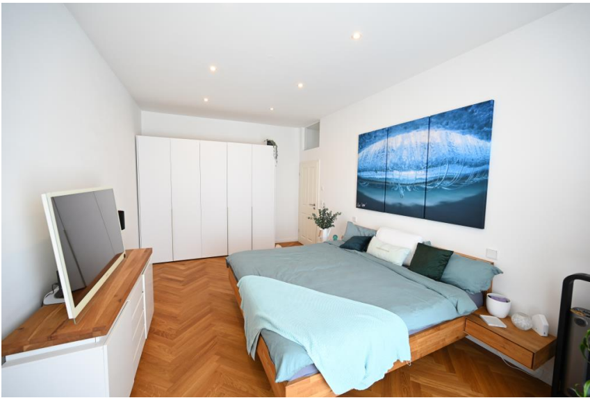
Großzügig & charmant