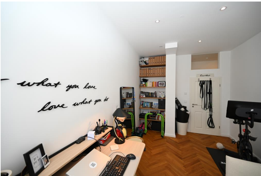
Drittes Zimmer bietet Flexibilität