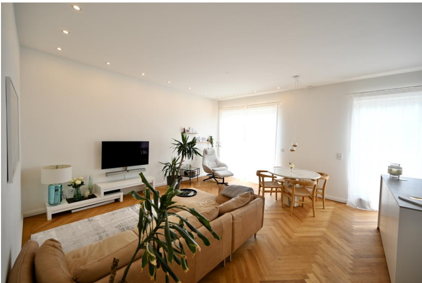
Bodentiefe Fensterfront bietet tolles Ambiente