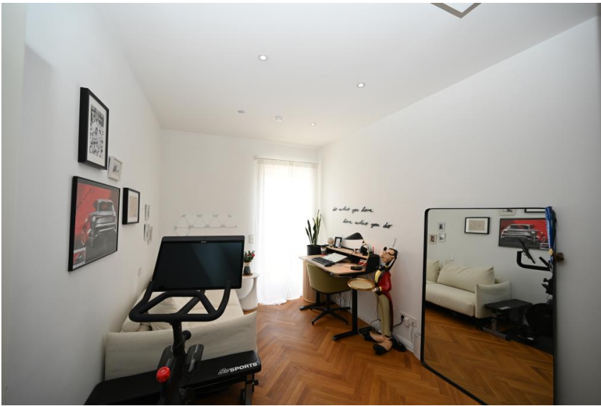
Büro/Kind mit Balkon