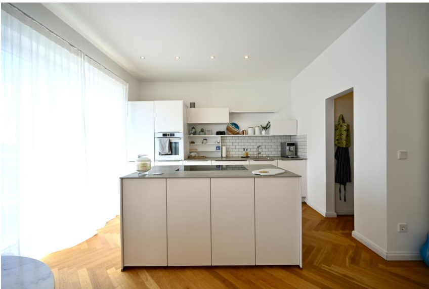
Hochwertige EBK inklusive