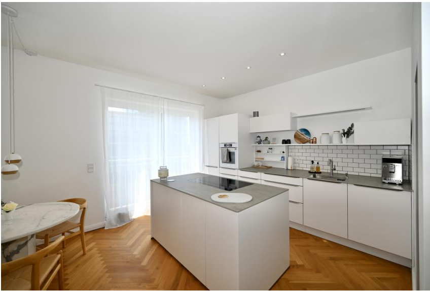
Herzstück der Wohnung