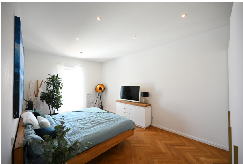
Schlafzimmer mit Balkon