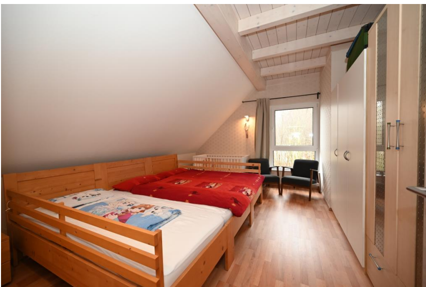
Schlafzimmer im DG