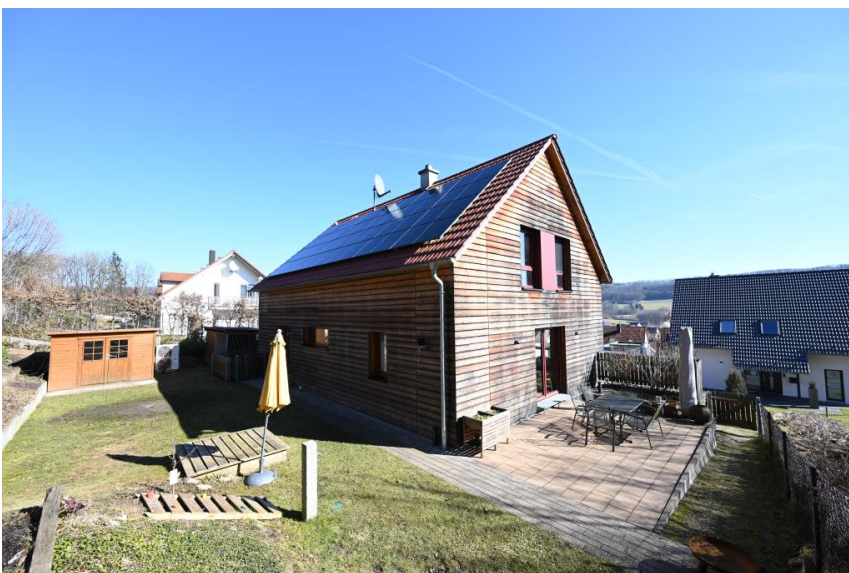
Sonnige Terrasse & Garten