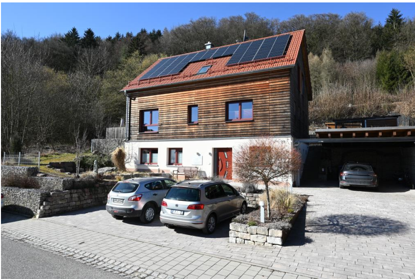
Architektenhaus für Wohnen & Arbeiten