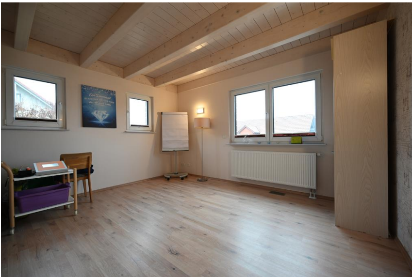
Schlafzimmer oder Büro