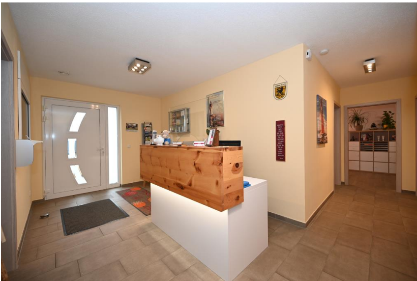
Der Praxisbereich - Empfang