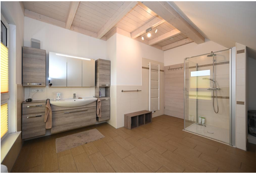
Familienbad in Vollausrattung