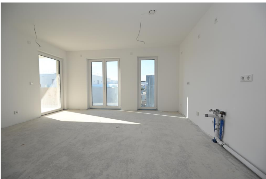
Heller Koch- u. Essbereich