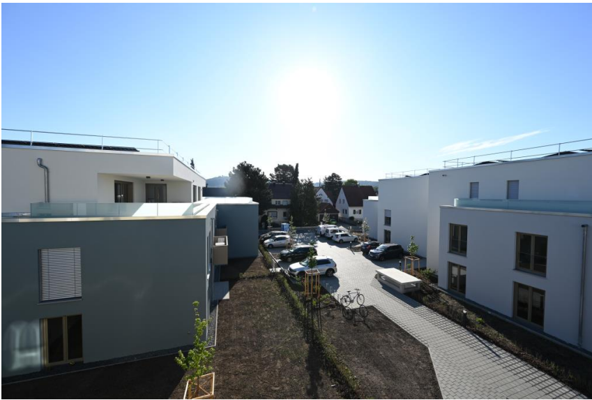
Fernblick bis zur Burg Wolfstein