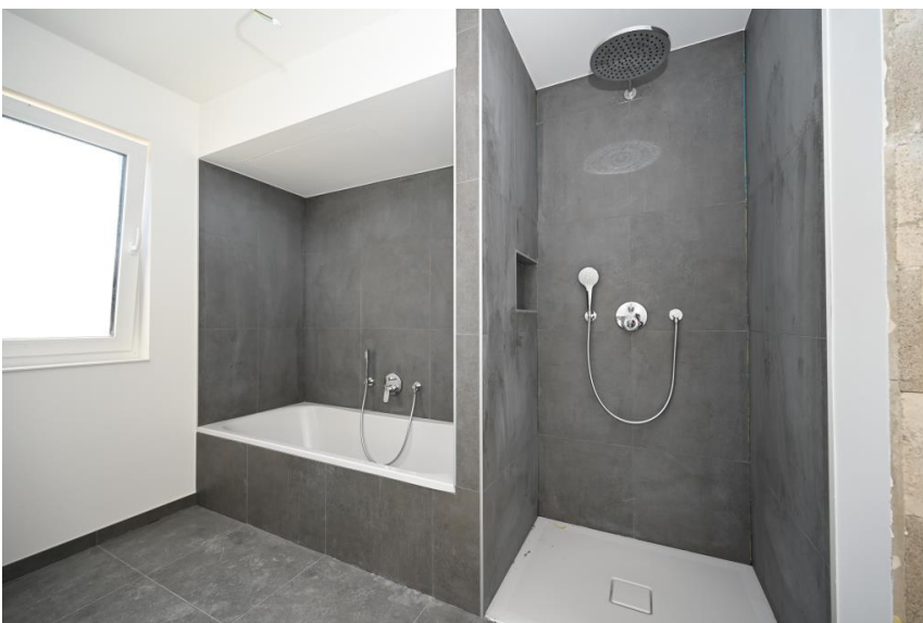
Voll ausgestattetes Bad