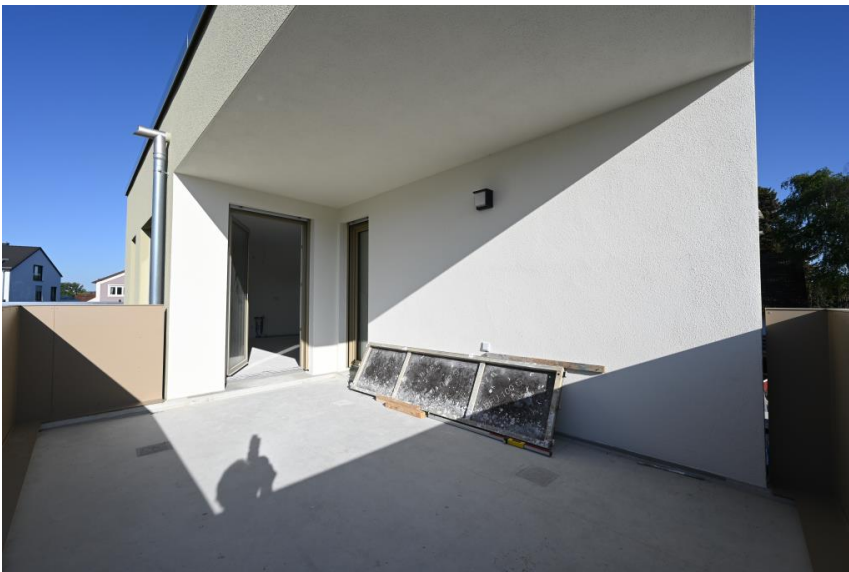
Herrlicher Ort der Ruhe