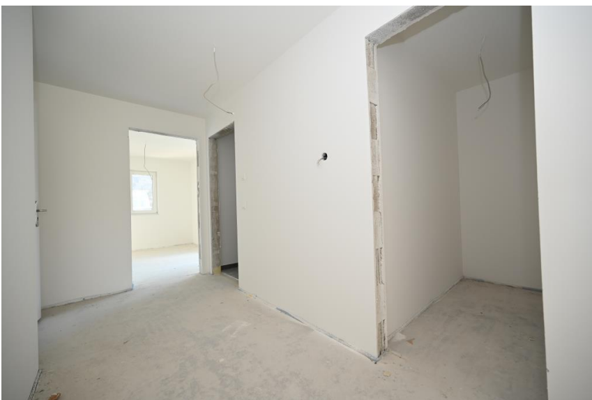
Garderobe und Abstell