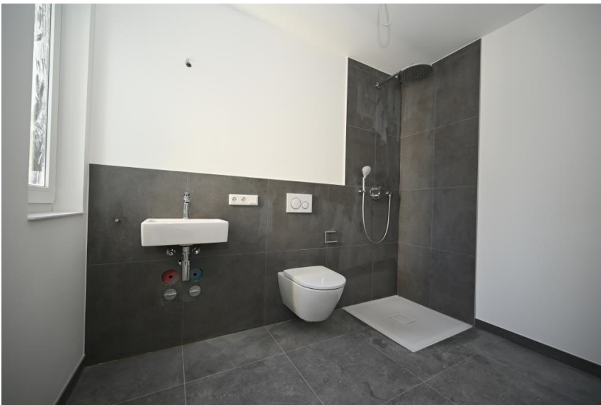
Gäste-WC mit Dusche