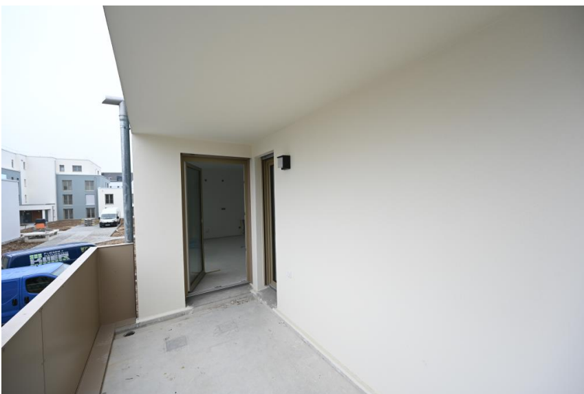
Groß & sonnig