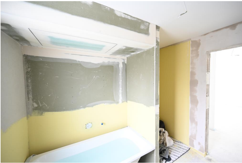
...mit Badewanne und Dusche