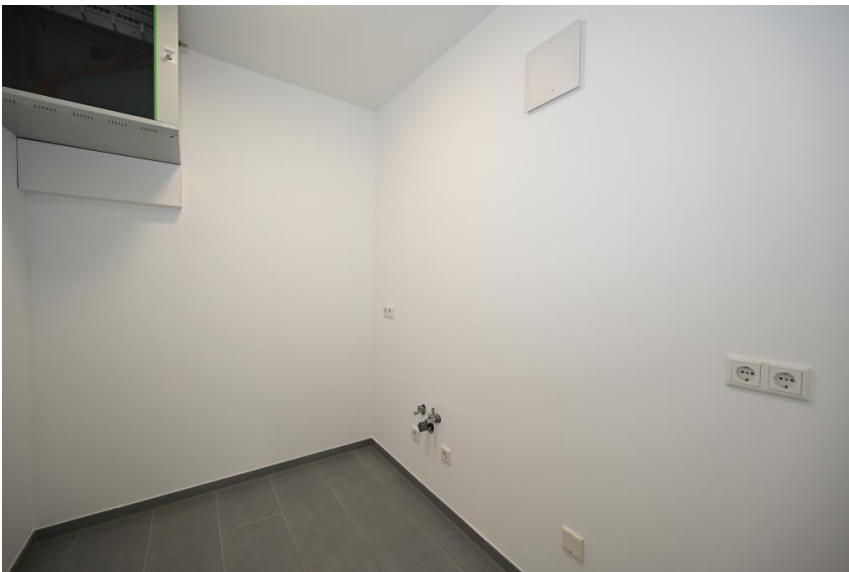
Platz für den Server