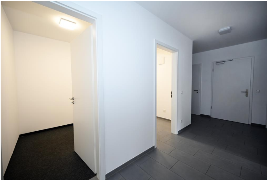
Lager + Küche