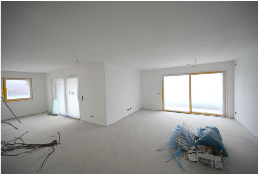
Offenes Wohnen mit Fensterfront