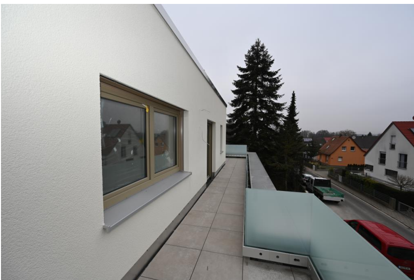
Terrassenzugang von allen Wohnräumen