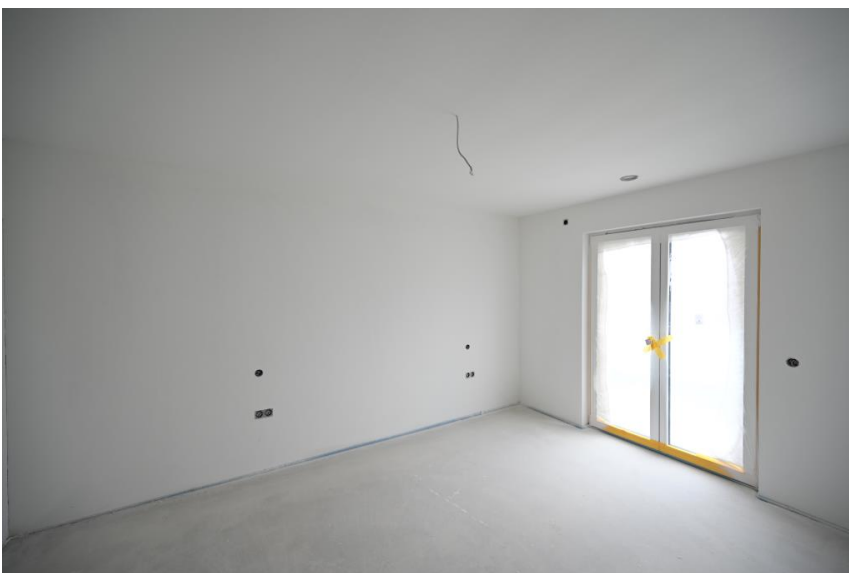
Schlafzimmer mit Zugang zur Terrasse