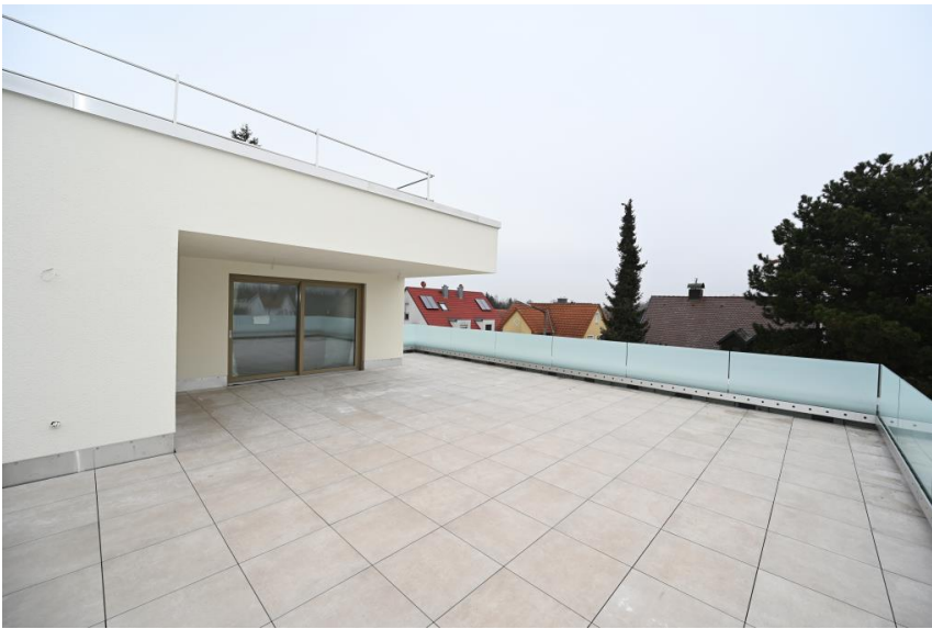
Wohnen über den Dächern