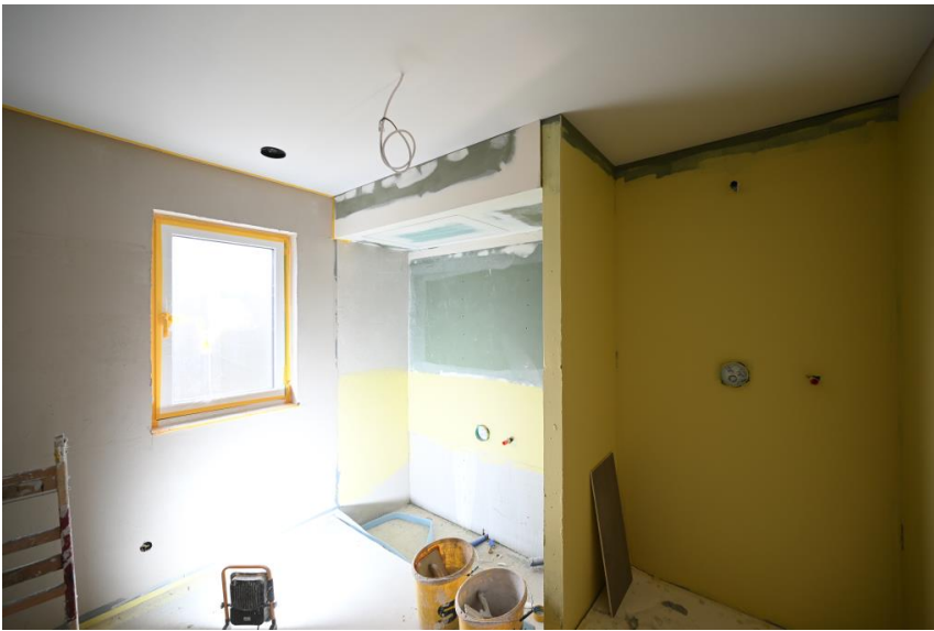
Badewanne und Dusche