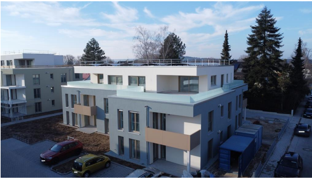
Sehr attraktive Wohnanlage