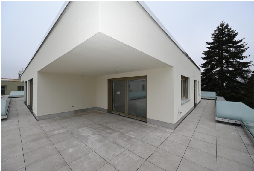
Sonne, Freiheit Ausblick