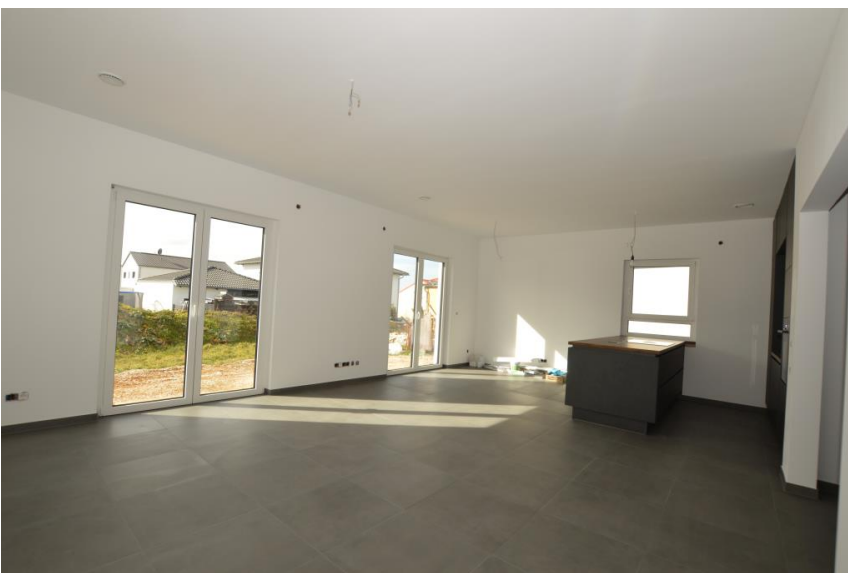
Großzügig & offen