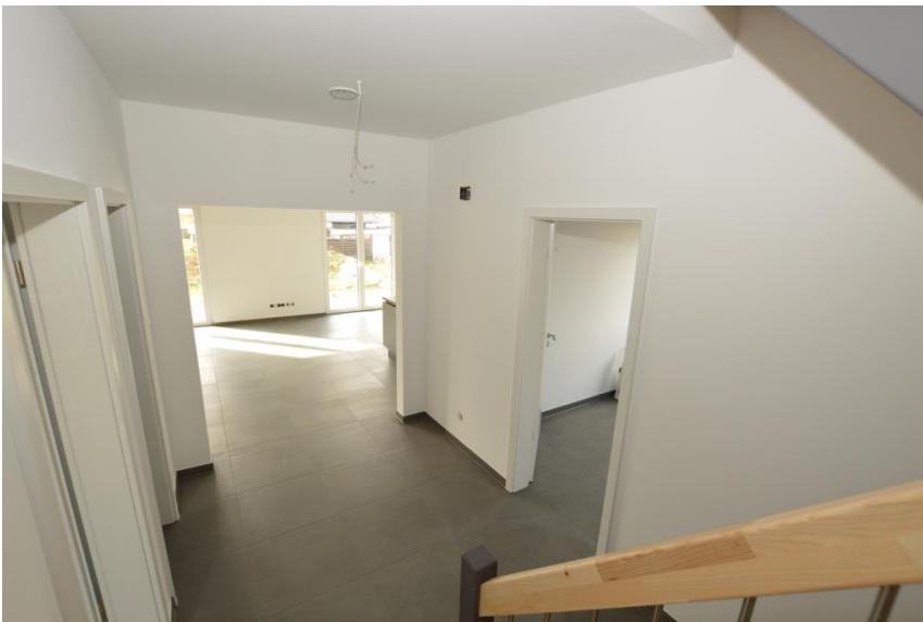
Hell & freundlich