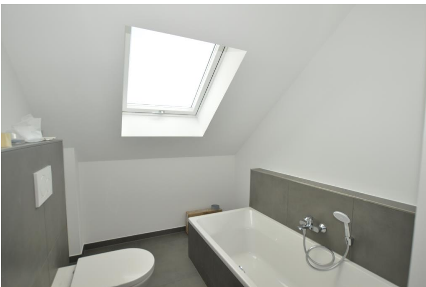
Bad in Vollausstattung