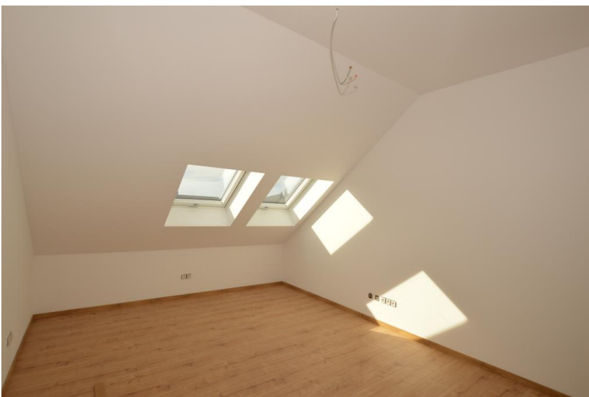
3 große Schlafzimmer