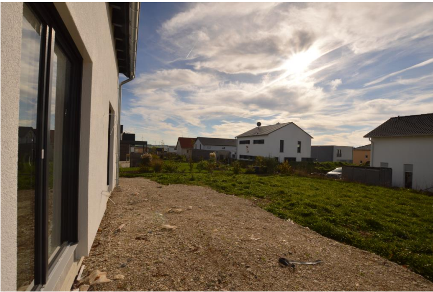
Große Terrasse mit Sichtschutz