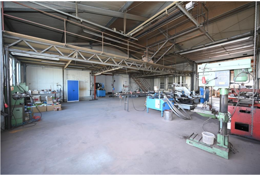
Isoliert und beheizt