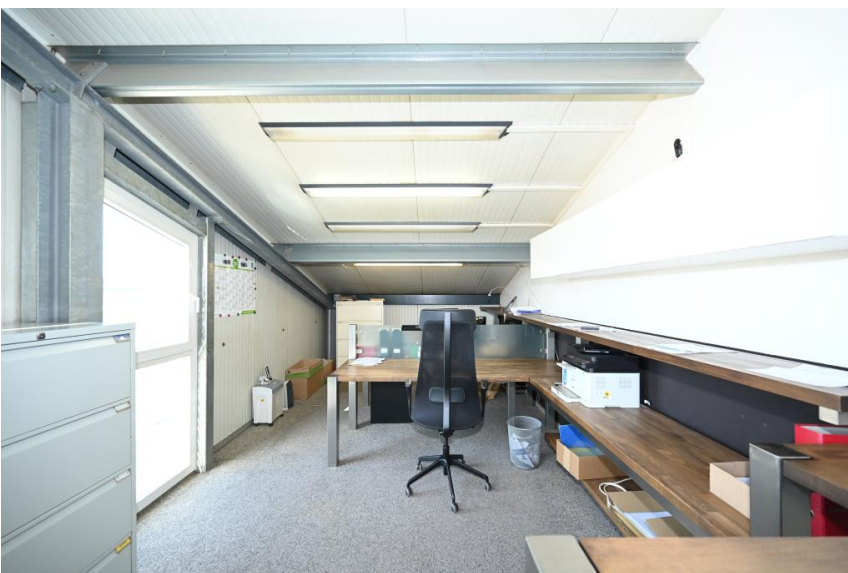
2x Büro Obergeschoss