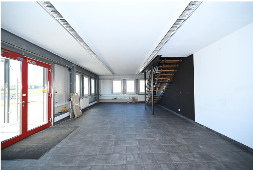
Angrenzend in die Produktion