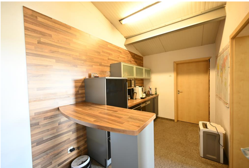
Teeküche + Abstell