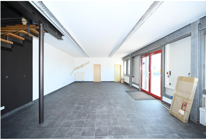
ca. 70m 2 Ausstellung