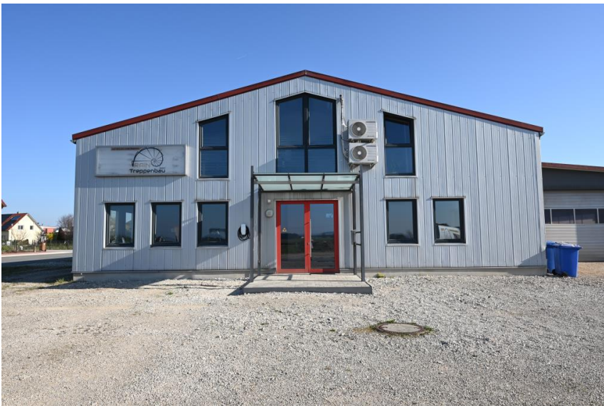
Ausstellung und Büro