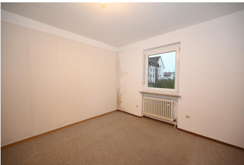
... günstiger Wohnen