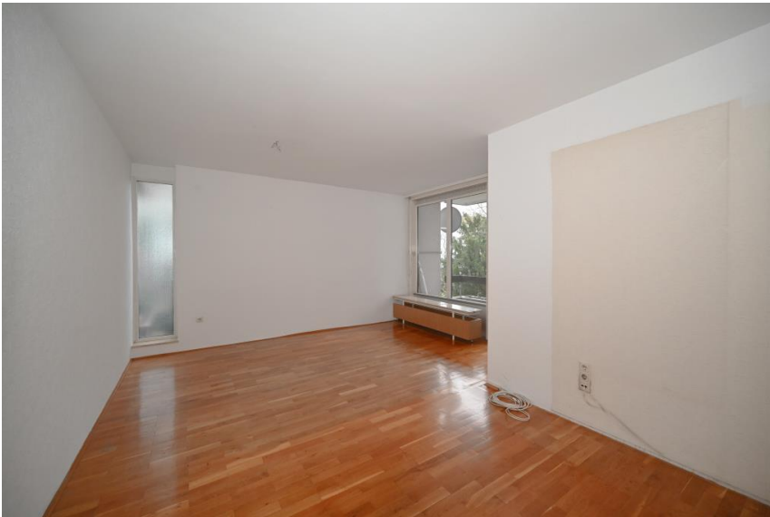
Wohnen mit Parkett