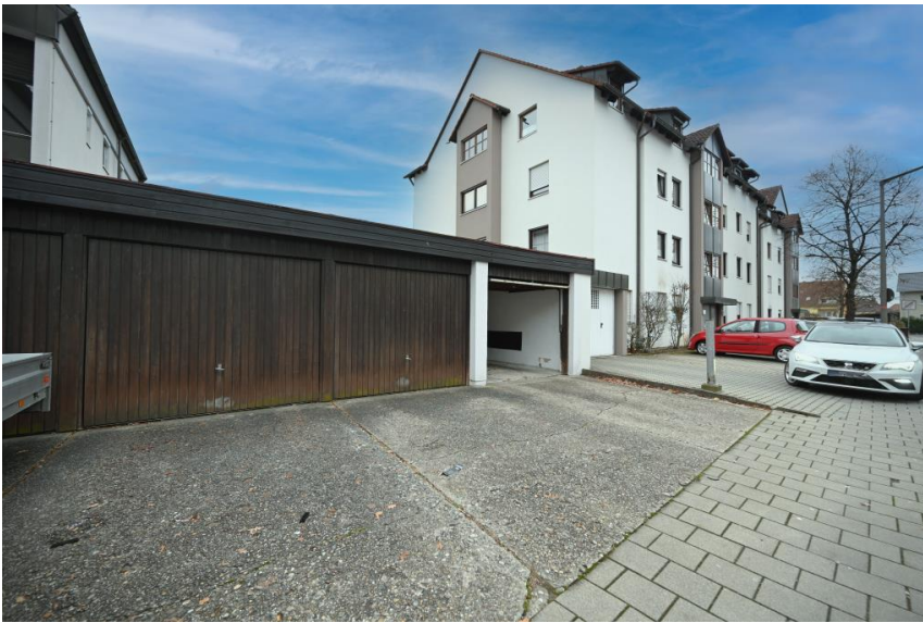
Garage auf Wunsch