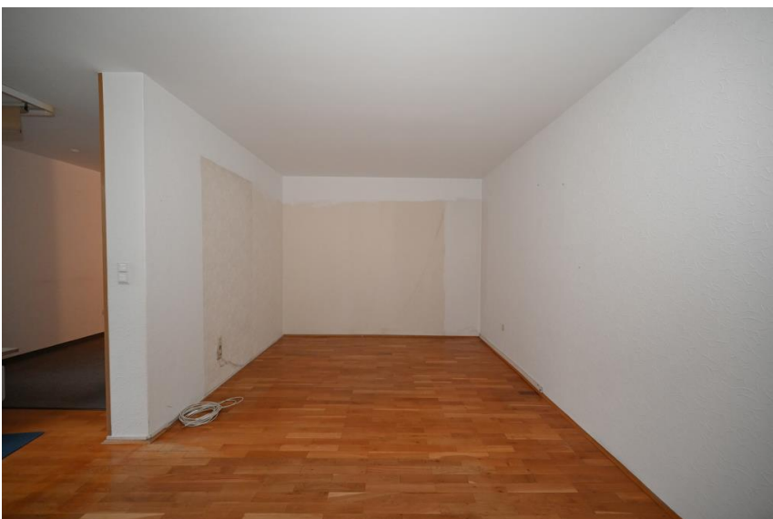
Offen und doch getrennt