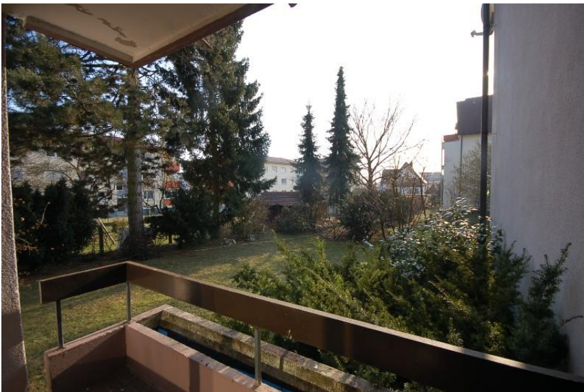
Blick in den Garten