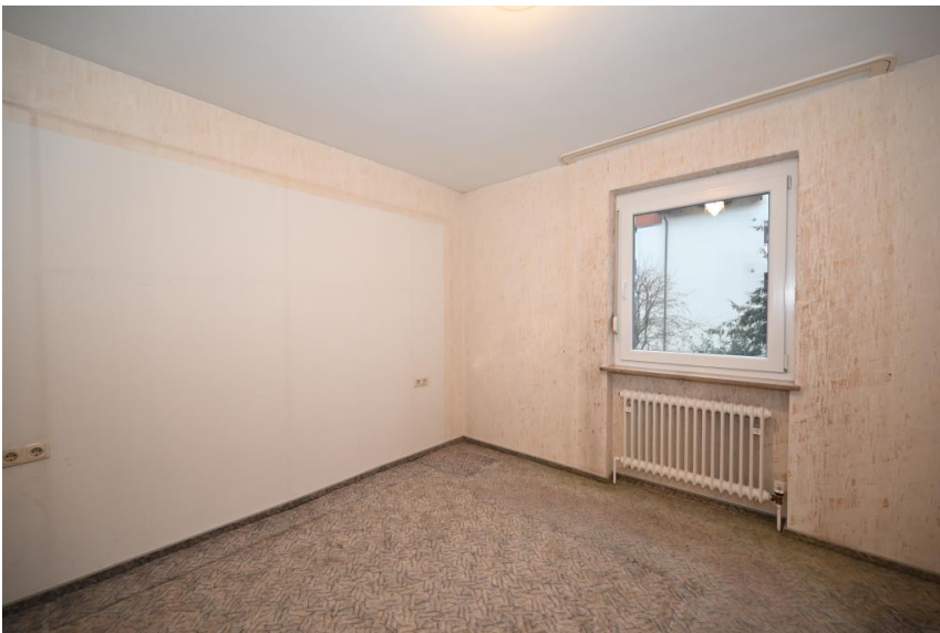
Selber renovieren ...