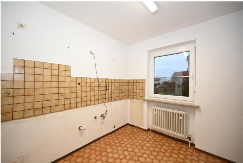
Küche + Wirtschaftsraum