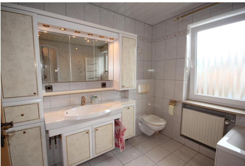
Mit viel Stauraum