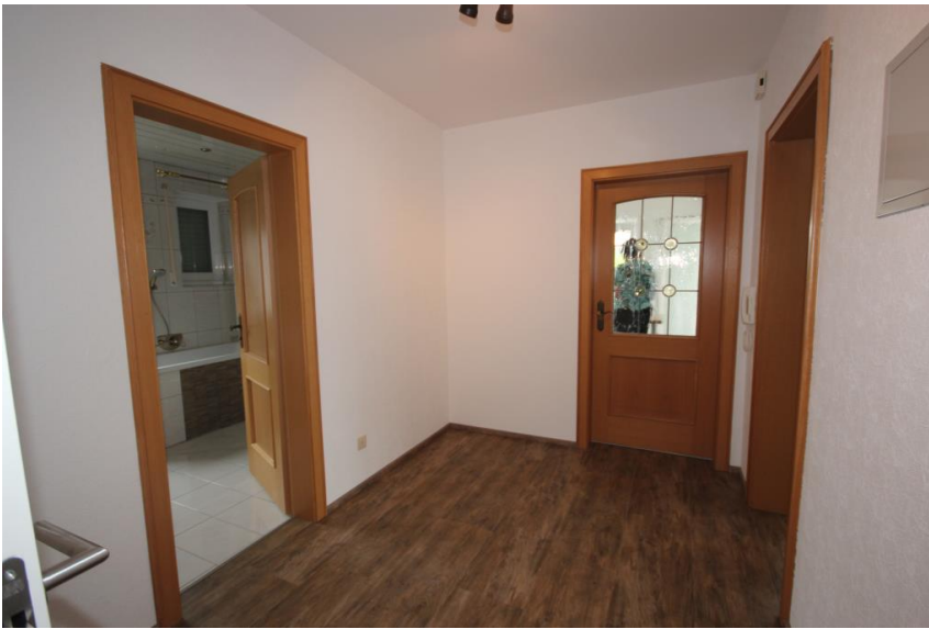
Platz für die Garderobe