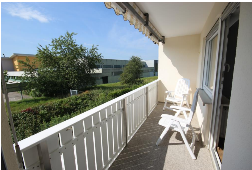
Balkon in schöner Größe

Energieausweistyp: BEDARF Endenergiebedarf: 135,50