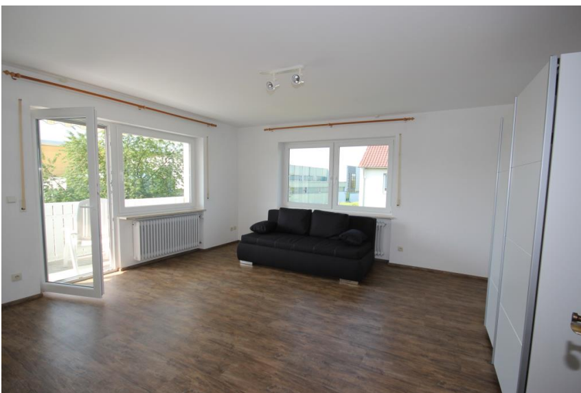
Schlafcouch und Kleiderschrank