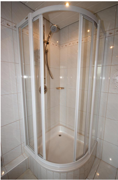
Wanne & Dusche