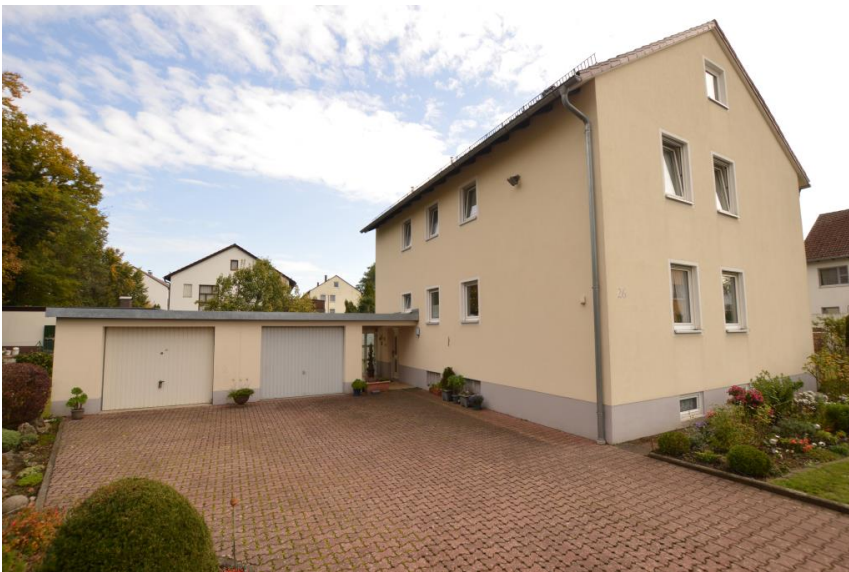
Garage direkt am Haus