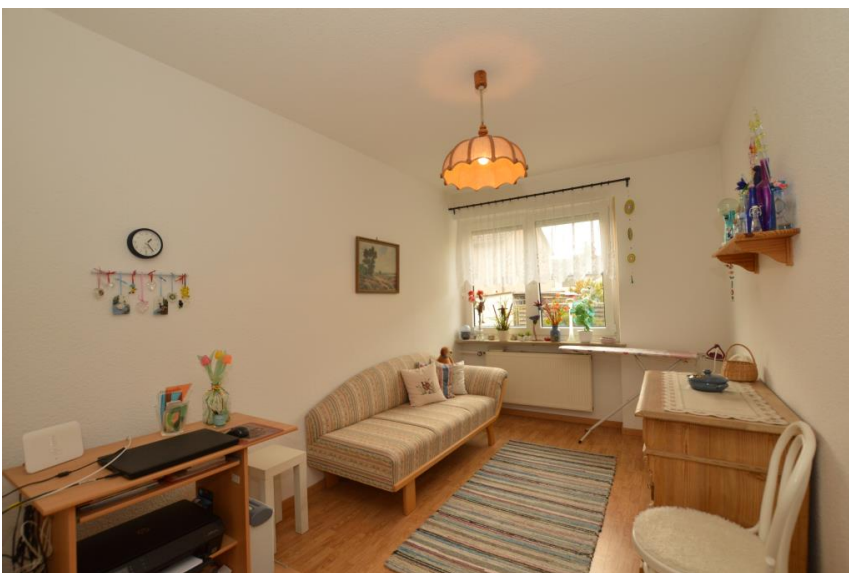
Kind / Büro