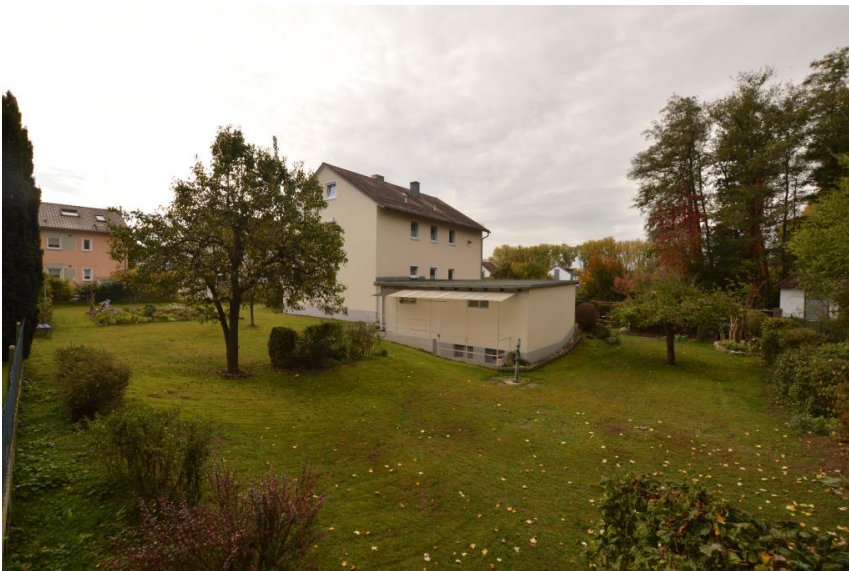
Traum für Gartenliebhaber