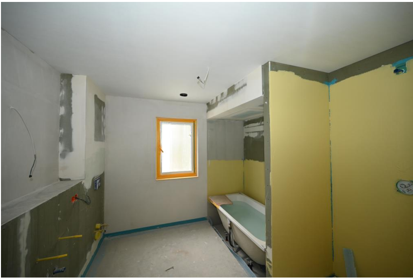
Modernes Bad mit Fenster