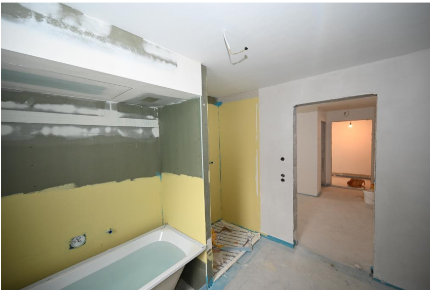
Badewanne und Dusche