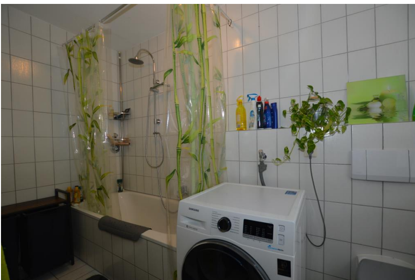
Wanne + Duschorrichtung