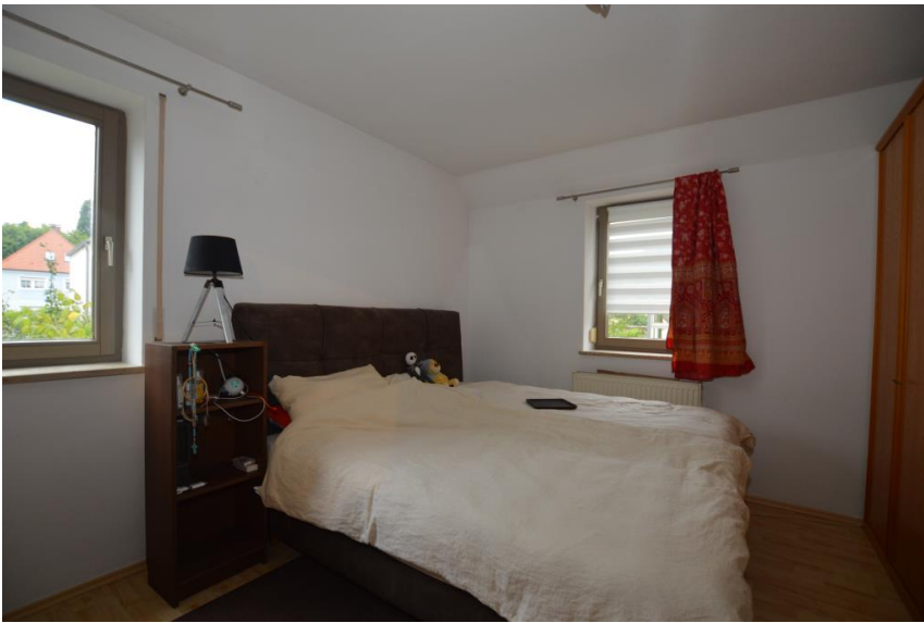
Schlafen zum Innenhof