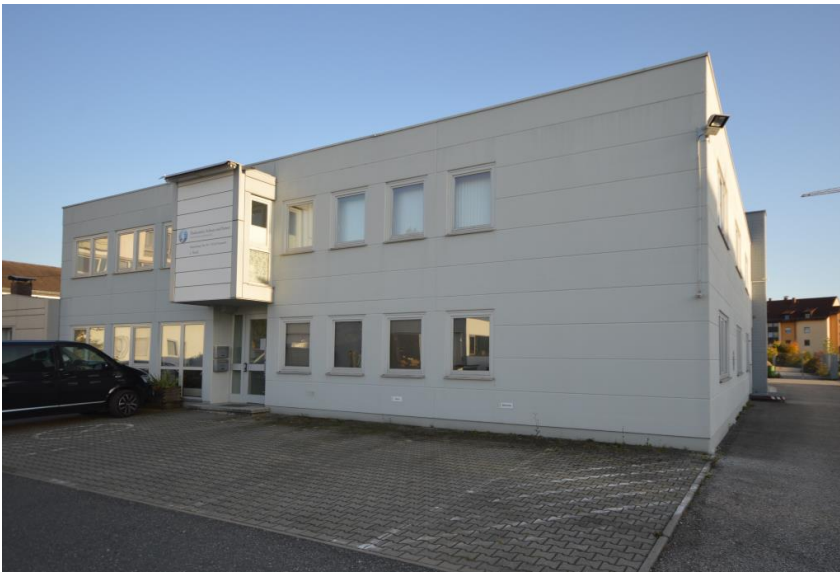
Im Erdgeschoss gelegen