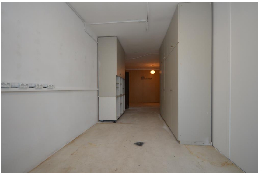
Fläche ca. 30 m 2