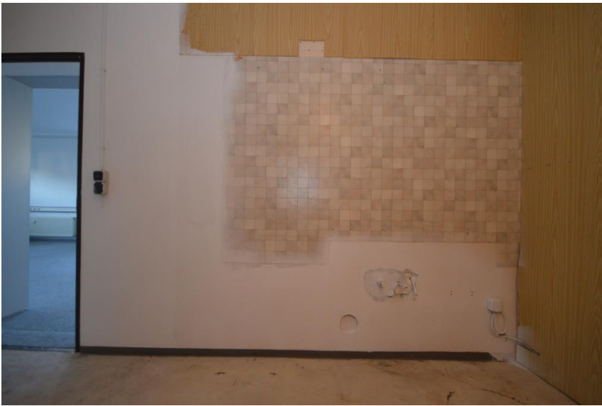
Platz für Teeküche