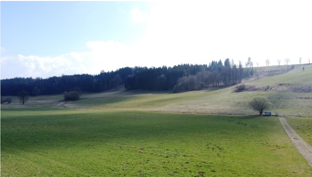
Blick über Wiesen