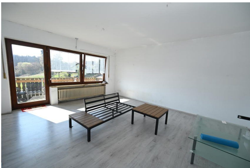
2 Eigenständige Wohnungen