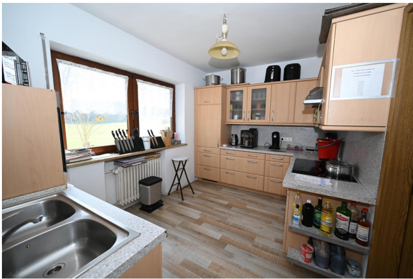
2 Küchen möglich