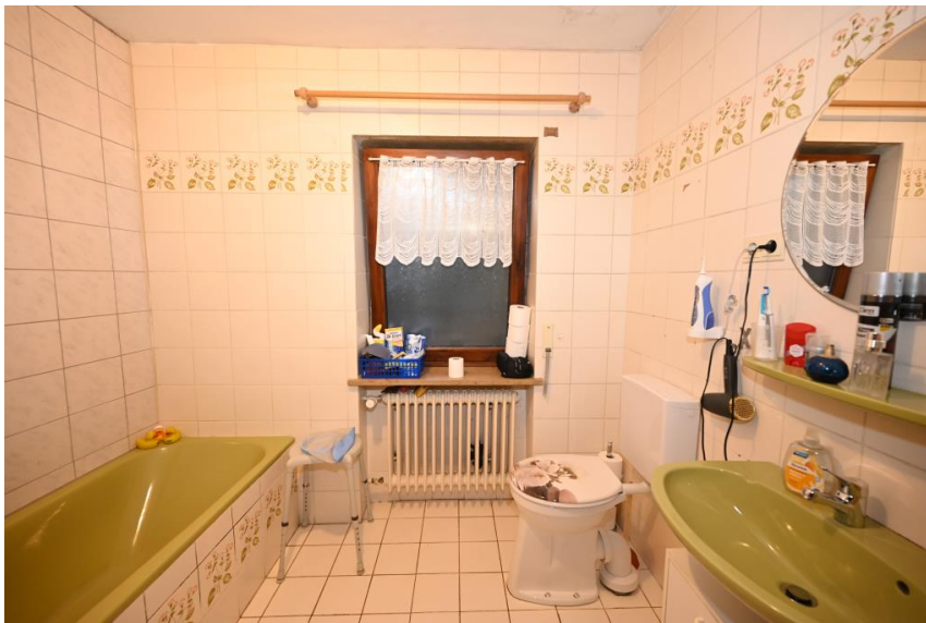
2 vollwertige Bäder