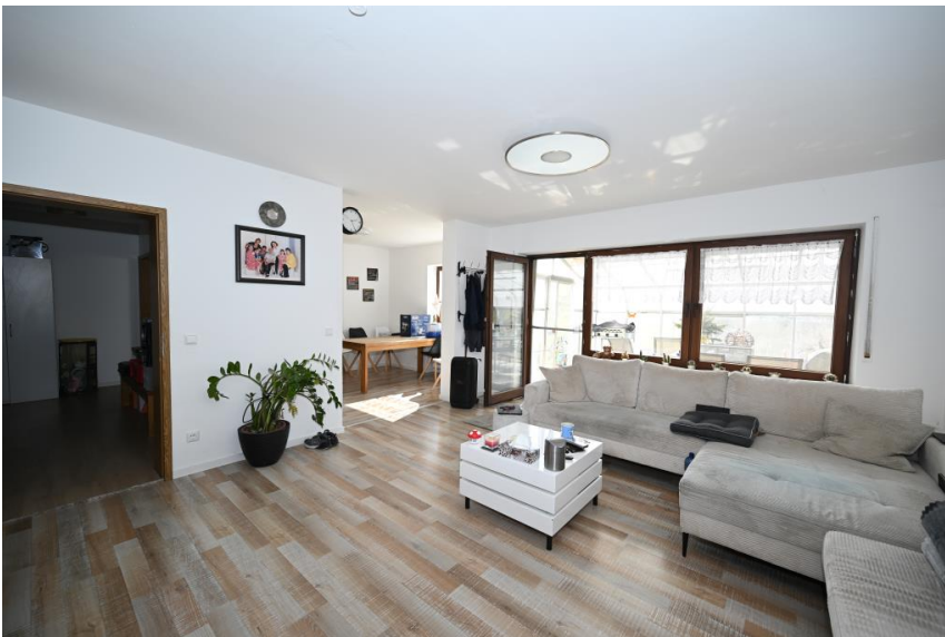
Wohnen & Essen