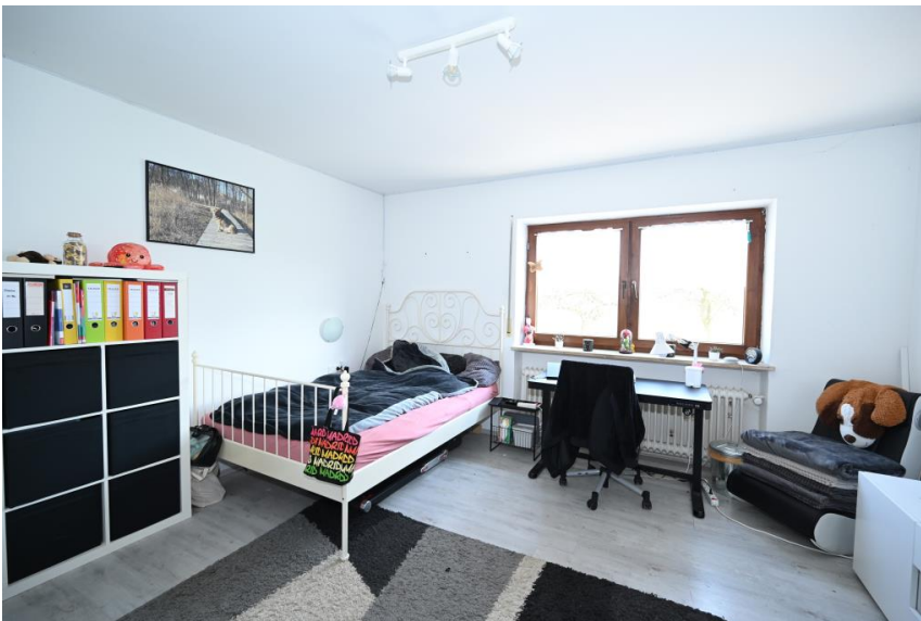
Hell und freundlich