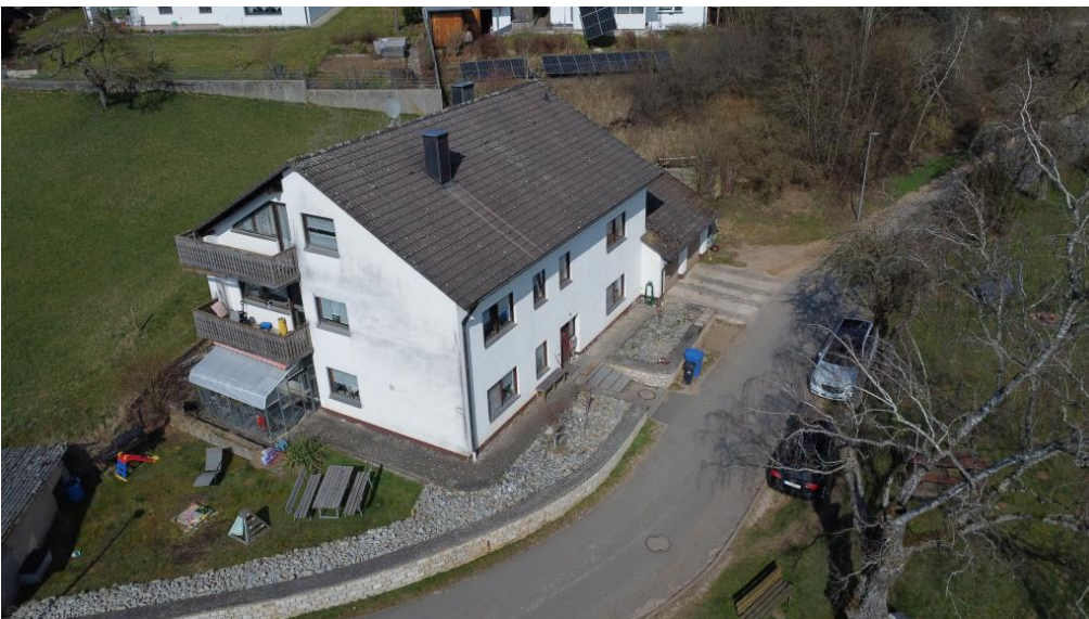
3 Garagen inklusive