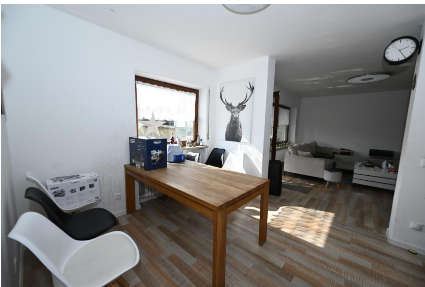
Essplatz nah an der Küche