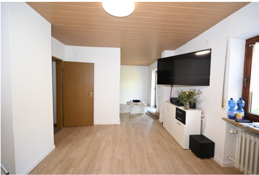
Alle Zimmer in schönen Größen