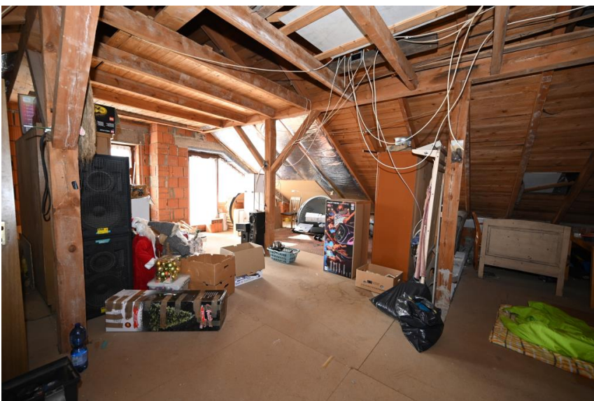
DG mit Ausbaupotential