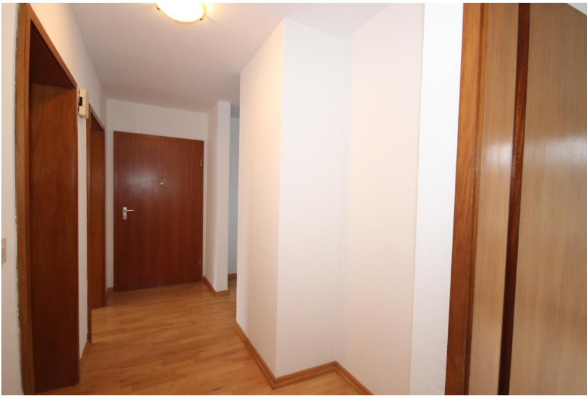
Platz für Garderobe