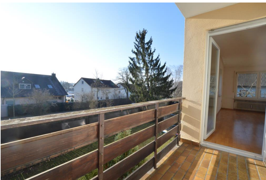
Balkon nach Süden