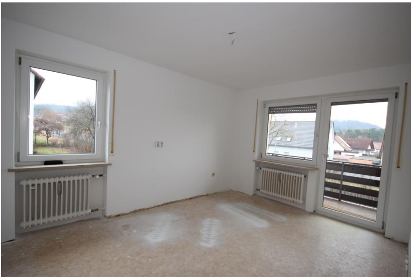
Wohnküche mit Balkonzugang