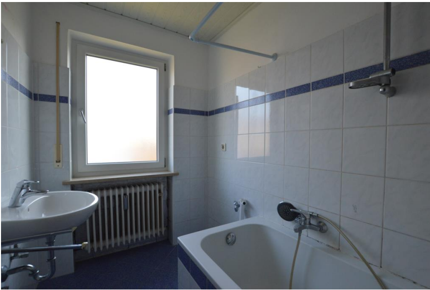
Bad mit WM-Anschluss