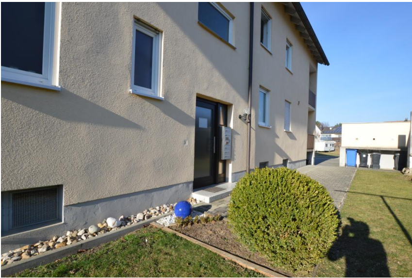
Nur 5 Parteien