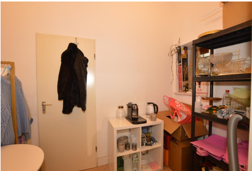
Nebenraum: Lager + Küche