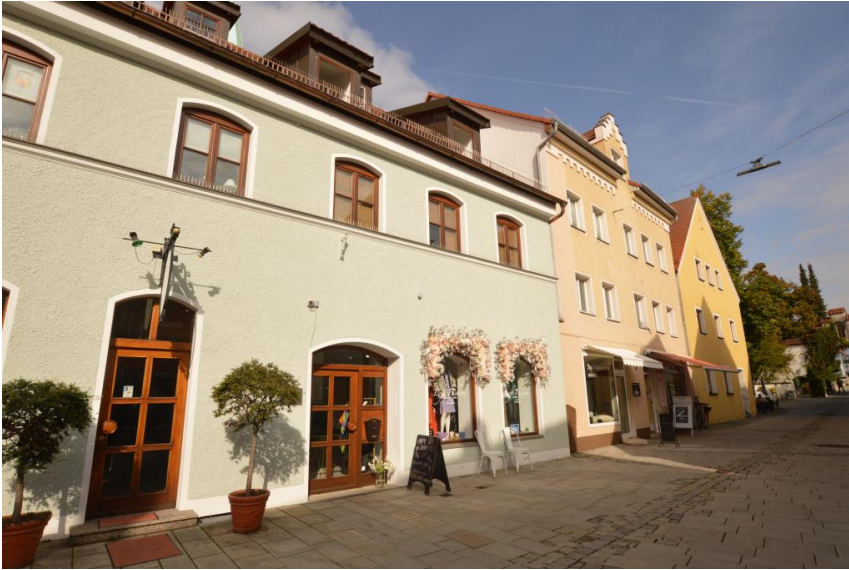
Gewerbemix mit Frequenz