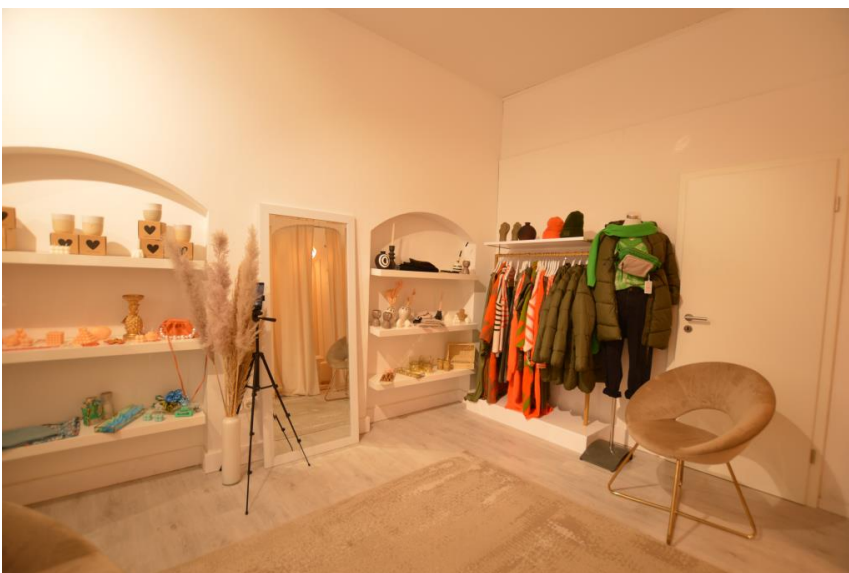
Platz für Regale