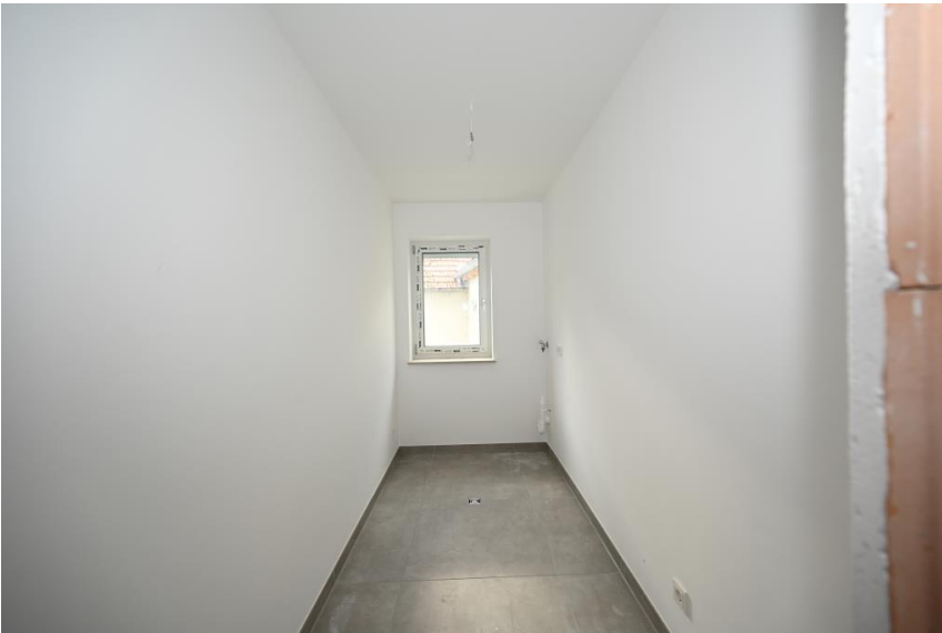
Abstellraum mit HWR