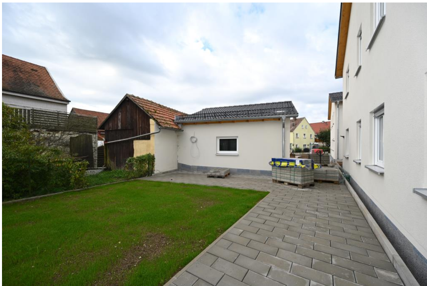
Nebengebäude für Fahrräder