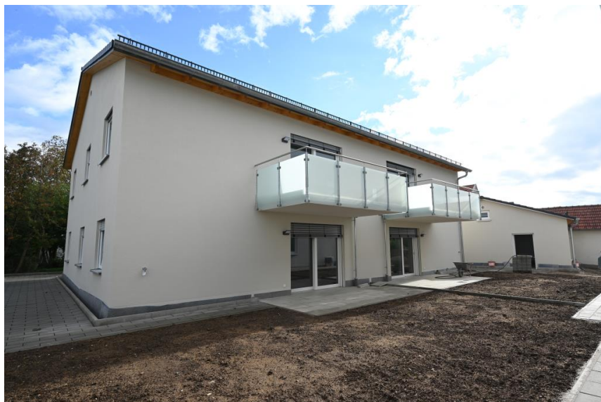
Balkone nach Südwest