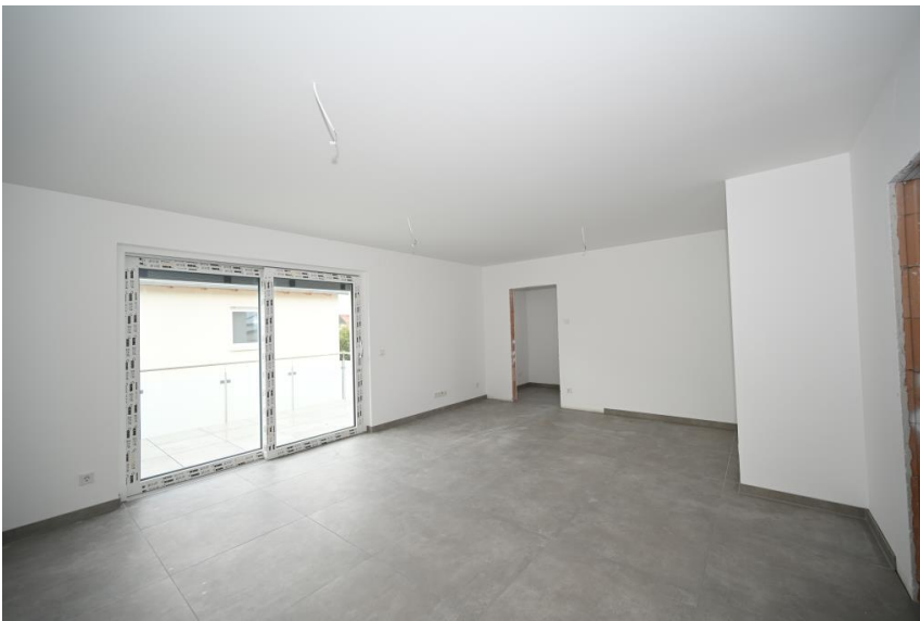
Wohnen, Essen, Kochen