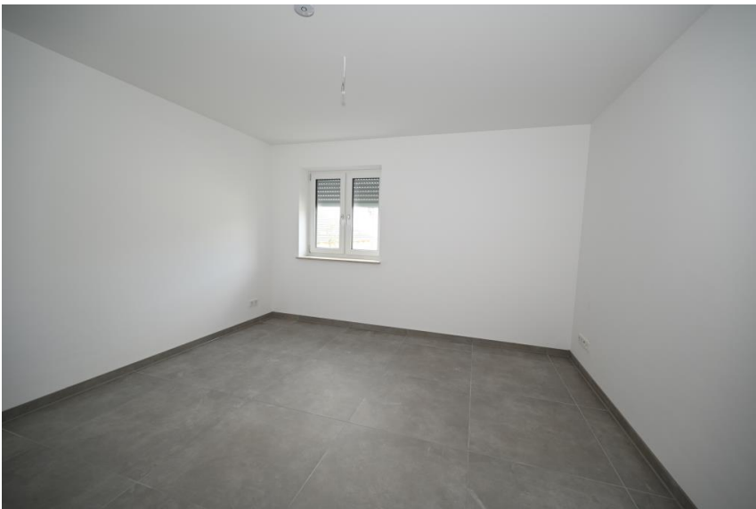
Schlafen abseits der Straße