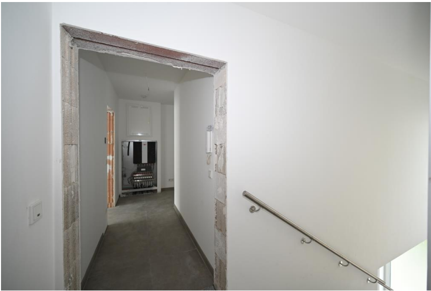
Komplett mit Fußbodenhgz.