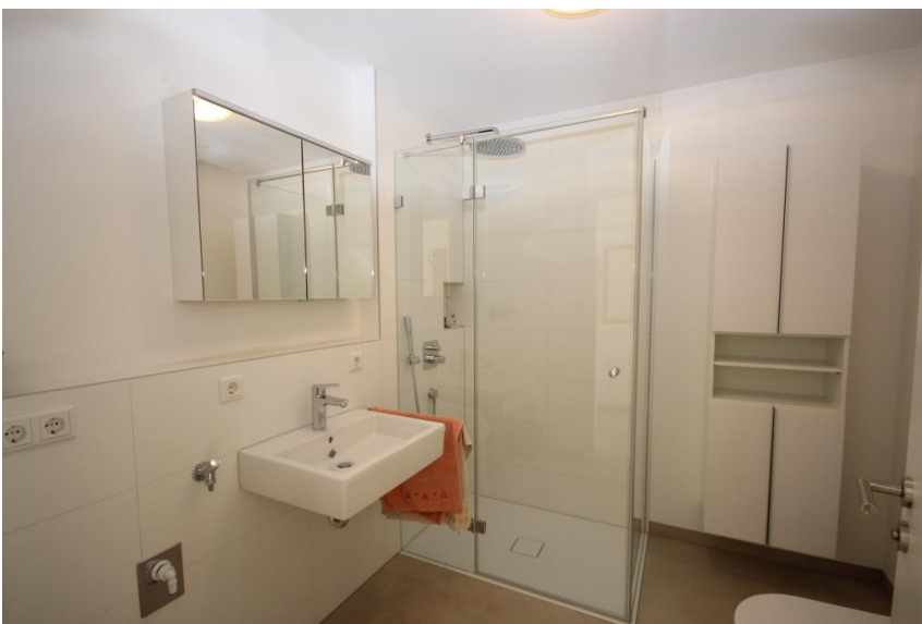
Duschbad, WC, Waschmaschinenanschluss