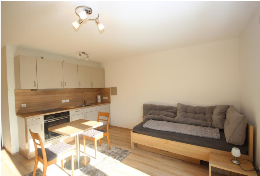
Neue Einbauküche inklusive