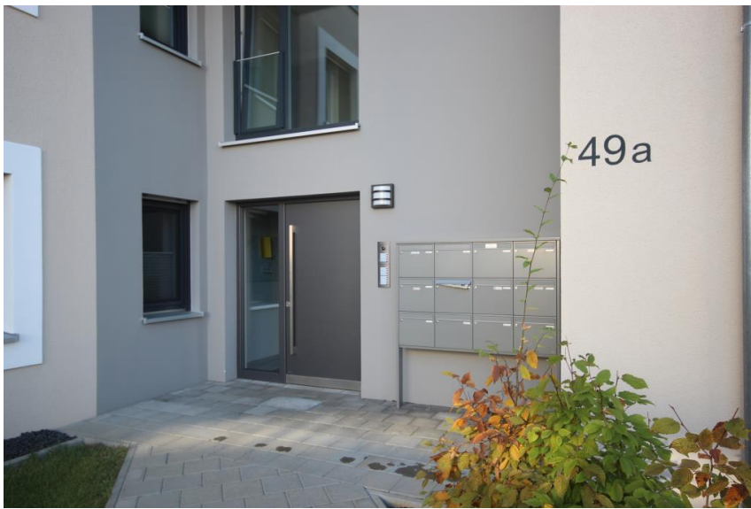
Lährer Weg 49a