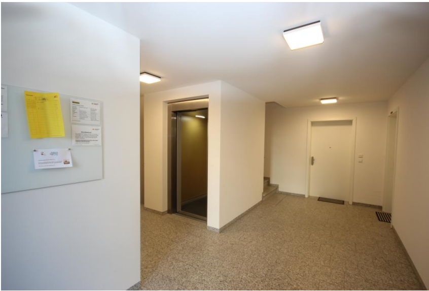
Aufzug & Kellerabteil