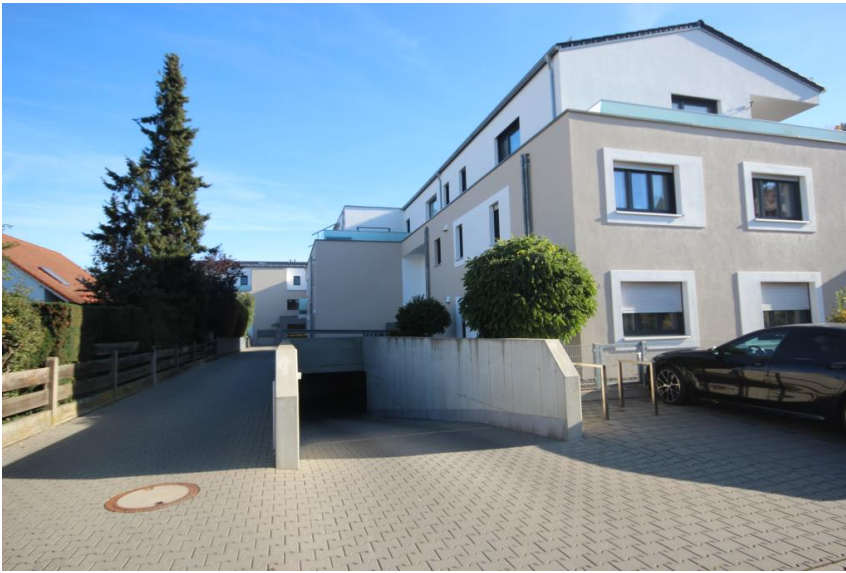
Tiefgaragenstellplatz auf Wunsch