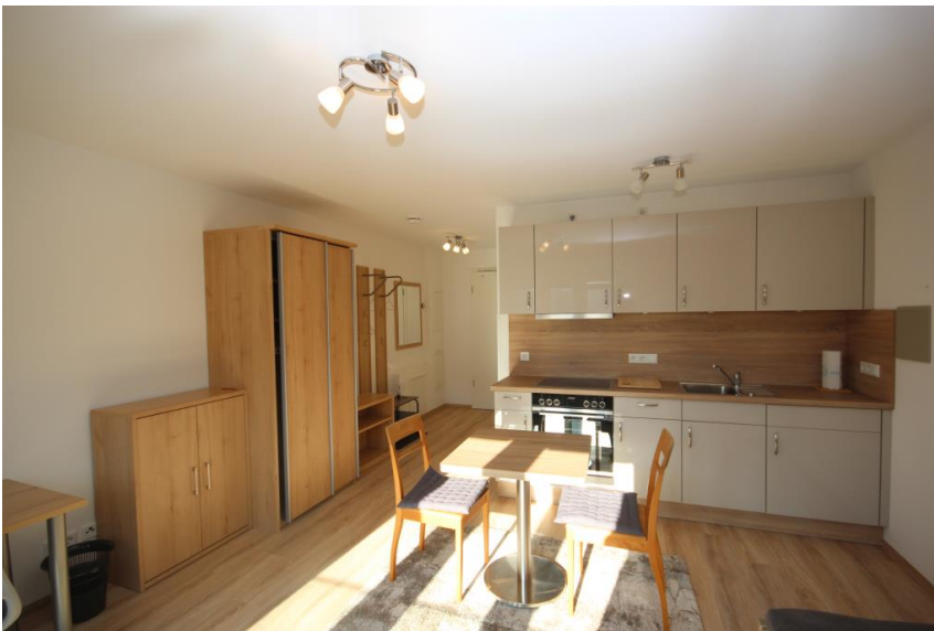
Zeitlos, praktisch eingerichtet