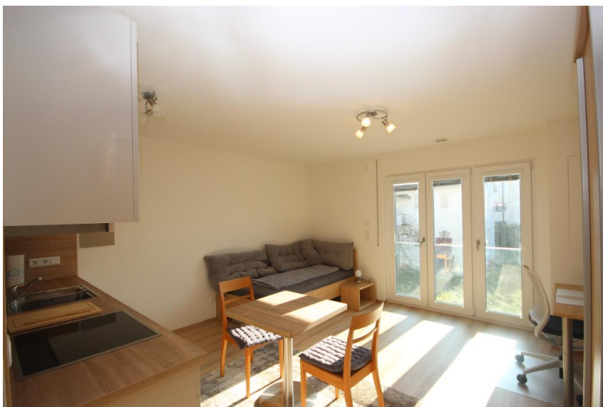
... sofort einzugsbereit!