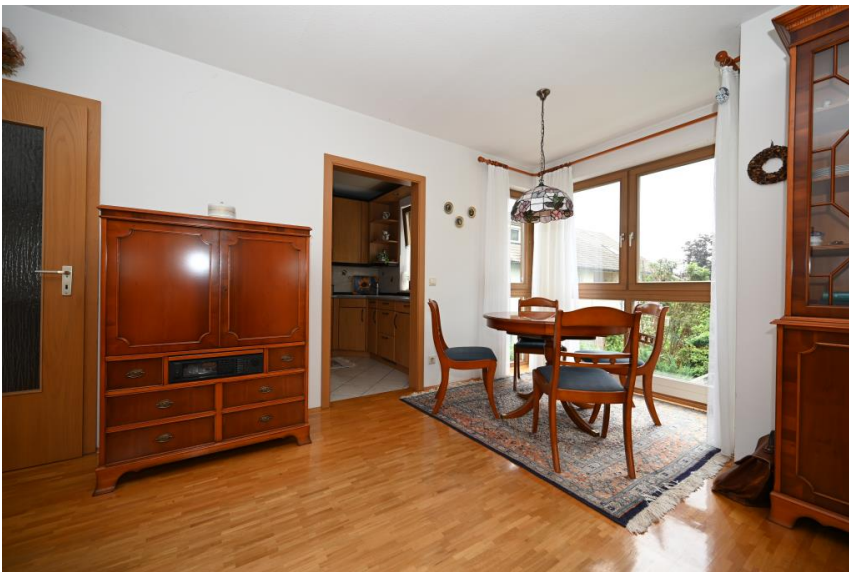
Mit viel Tageslicht