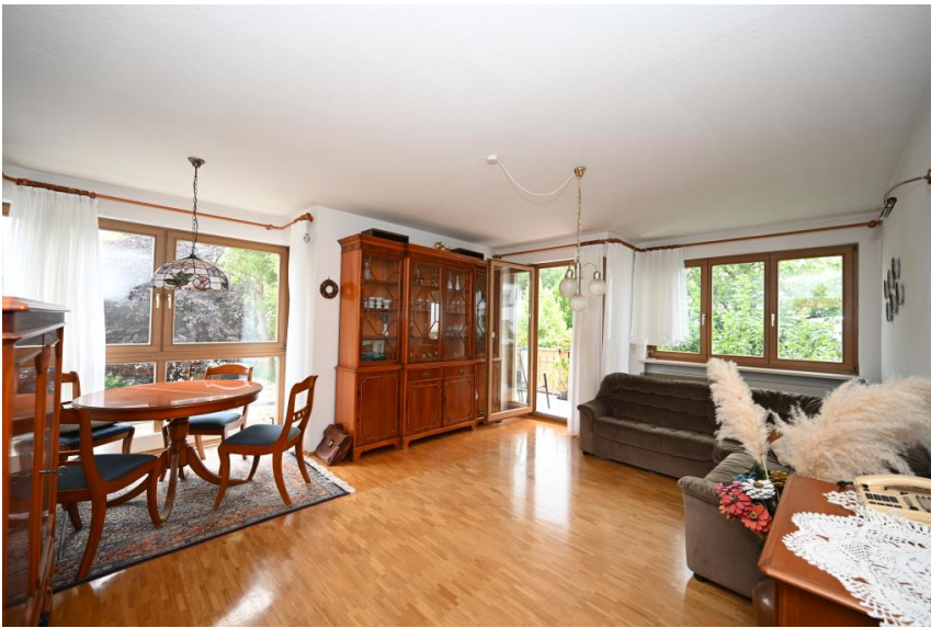
Der Wohn- & Essbereich