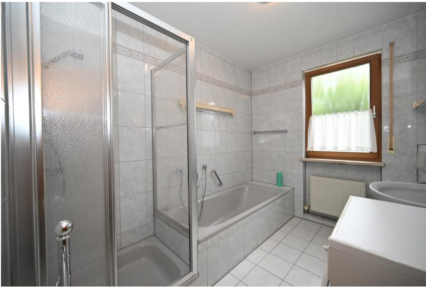
Bazimmer im Tageslicht