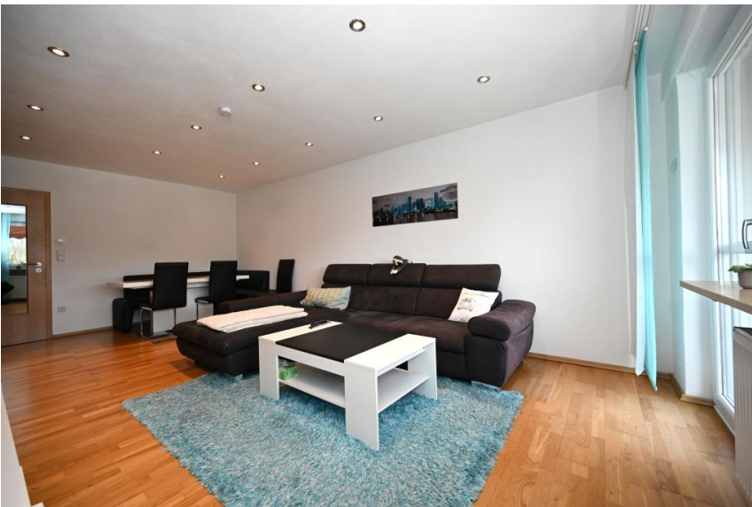
Geräumig & hell