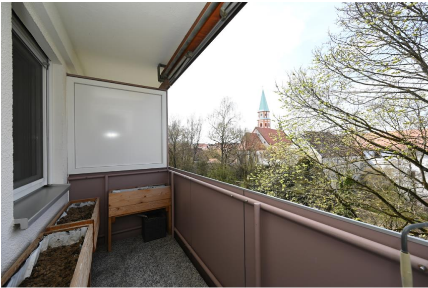
Balkon Richtung Stadpark