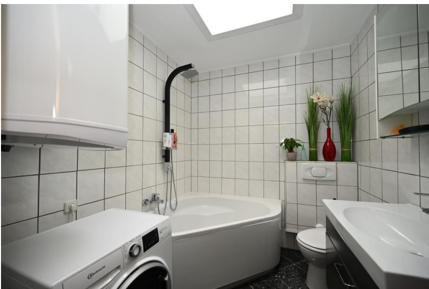
Badezimmer mit Tageslicht