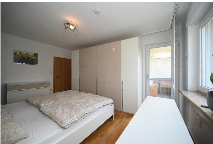
...mit Zugang zum 2. Balkon