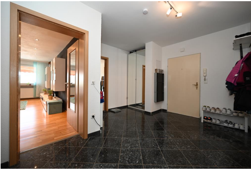
Gute Stellmöglichkeiten im Flur