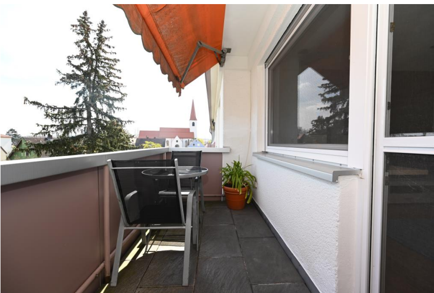
Balkon mit Ausblick