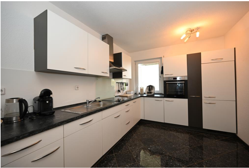
Wertige EBK inklusive