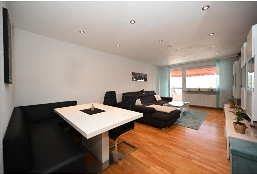
Der Wohn- & Essbereich