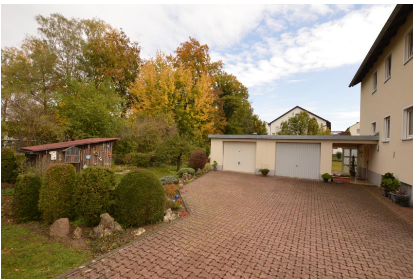
Garagen-Stellplatz auf Wunsch