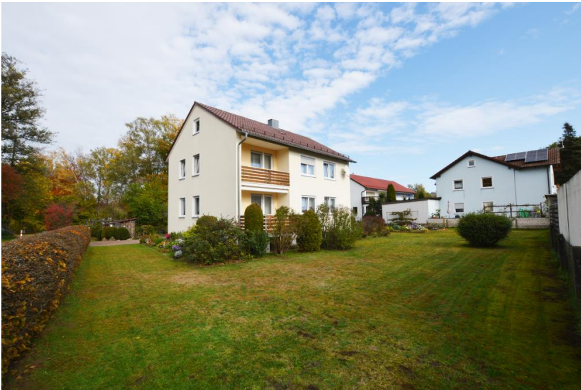
Wohnung im 1. OG