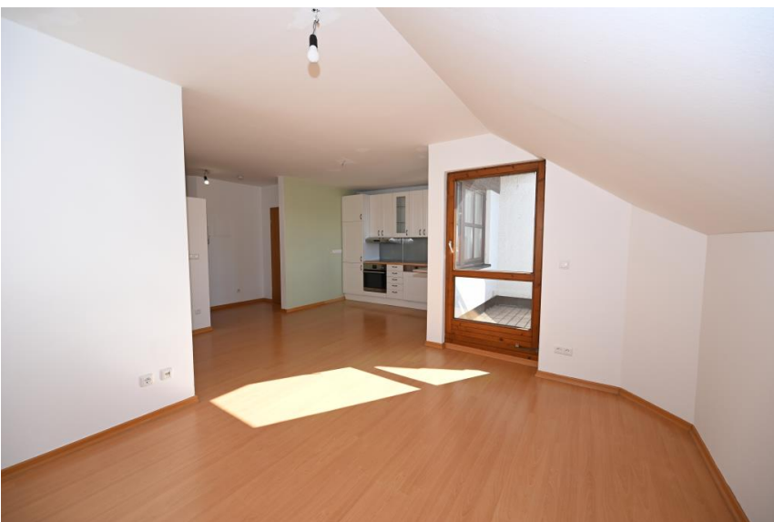
Offenes Wohnen mit Küche