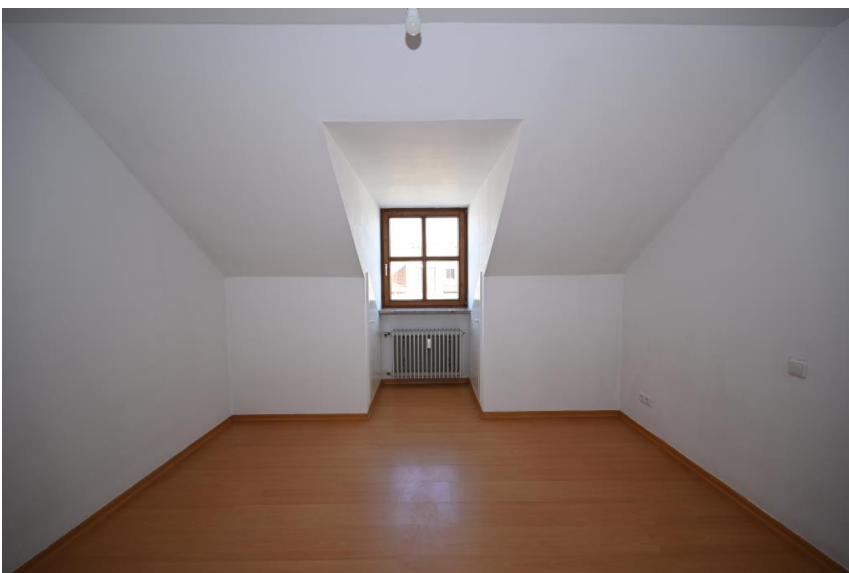
Schlafen abseits der Straße