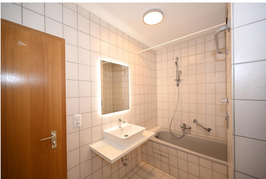
Alles was man braucht