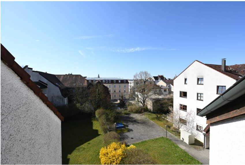
Weitblick über die Dächer