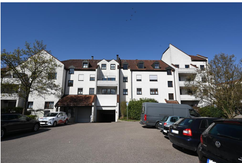
In klassischer Architektur