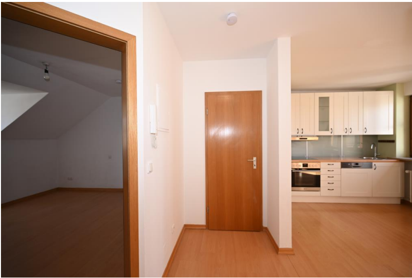
Abstellraum + Kellerabteil