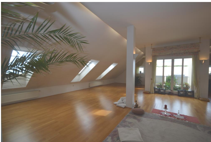
Entspannung + Balkon