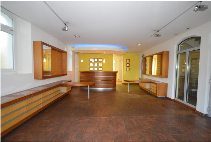
Einbauten auf Wunsch