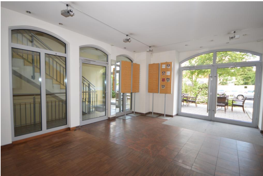
Viel Glas - viel Licht