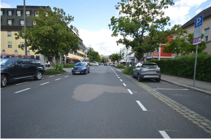
Frequentierte Lage: Bahnhofstraße