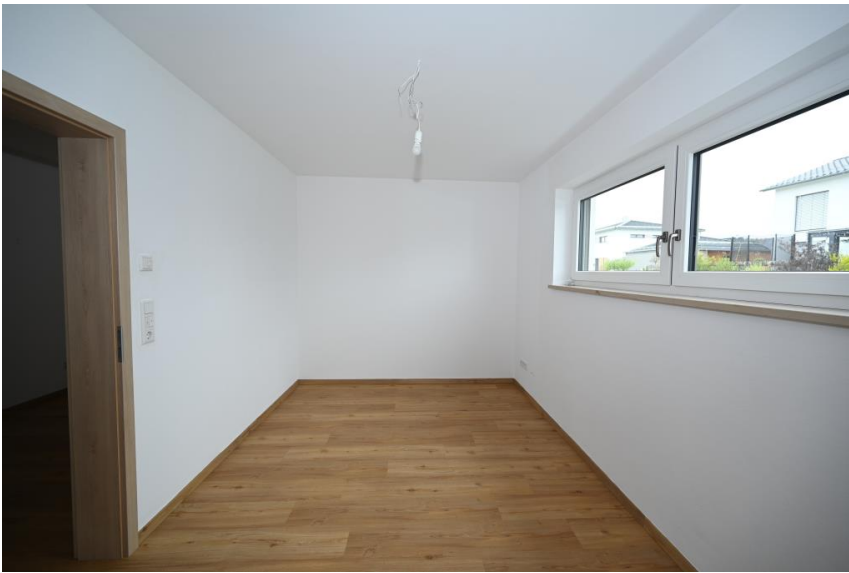
In schöner Größe