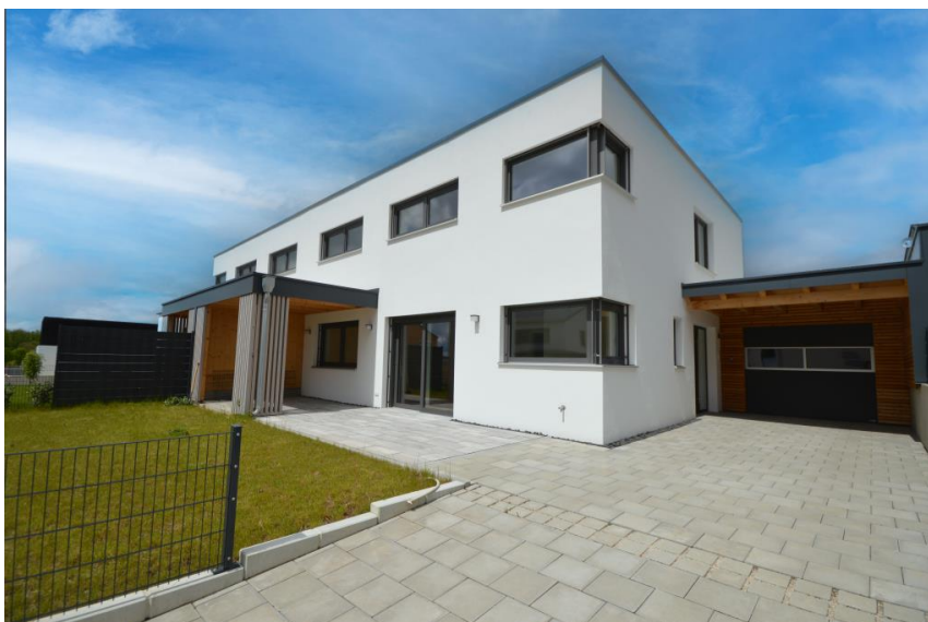
Wohnhaus mit Carport

Energieausweistyp: BEDARF Endenergiebedarf: 7,70