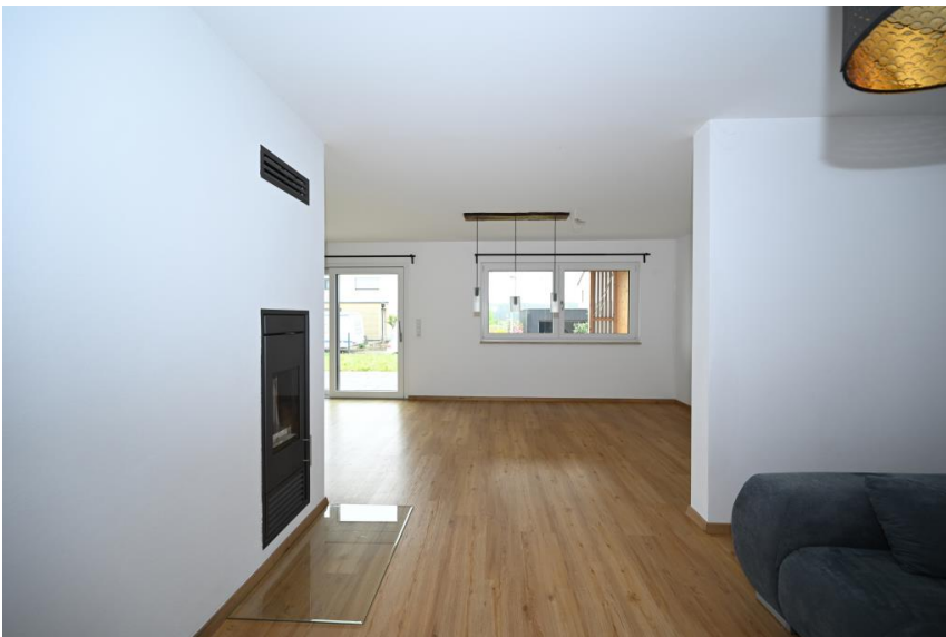
Wohnen mit Kaminofen