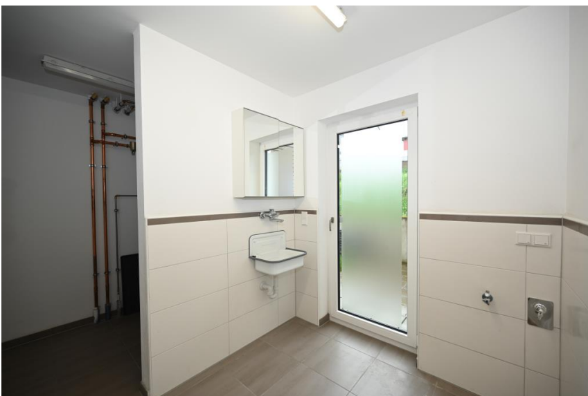
Hauswirtschaft / Technik