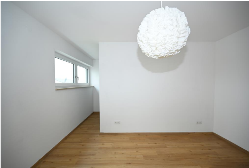
Schlafen mit Ankleide