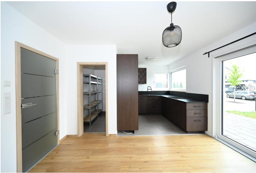
Einbauküche mit Speis