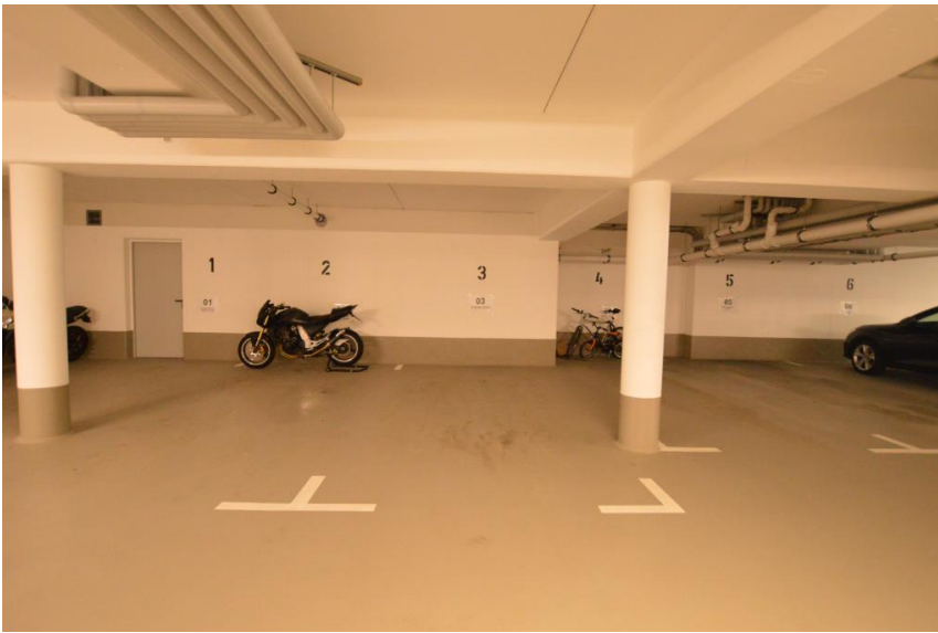
Tiefgaragenstellplatz auf Wunsch