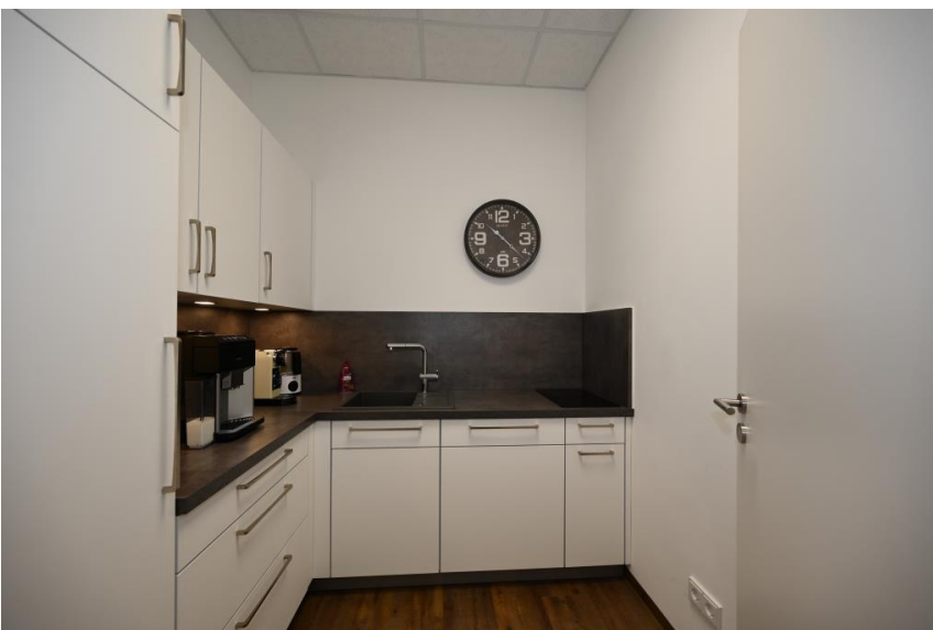
Teeküche - Gemeinschaft