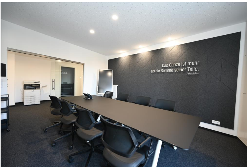
Besprechung - Gemeinschaft