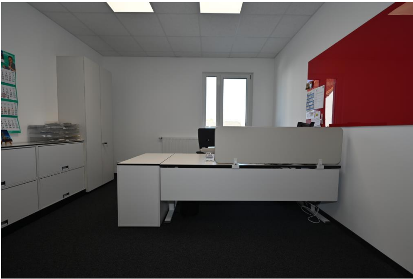
Voll möbliertes Büro