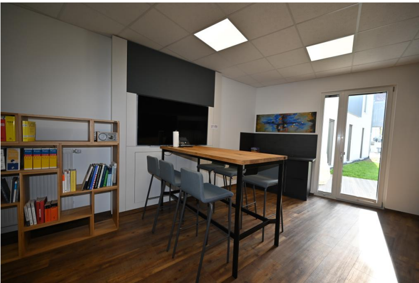
Für die Pause