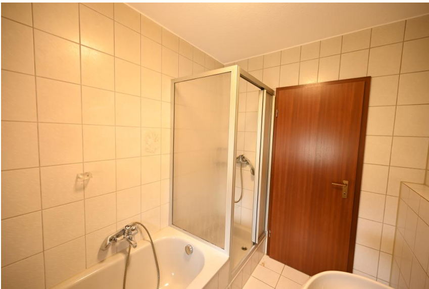
Wanne und Dusche