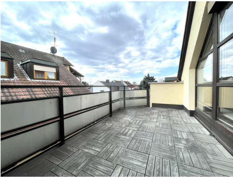
Balkon in Südausrichtung