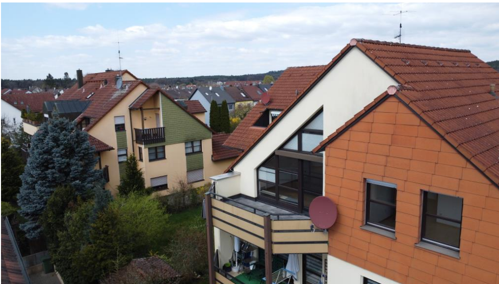
Uneinsehbar und groß