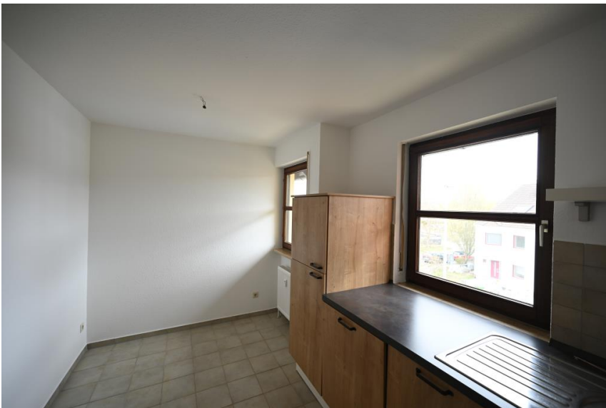
Platz für Sitzecke