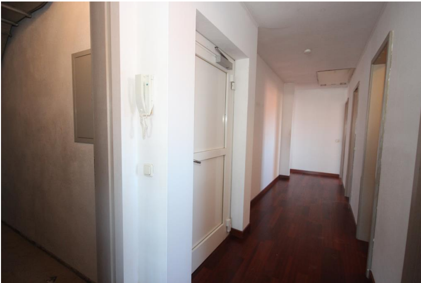
Flur mit Abstellraum