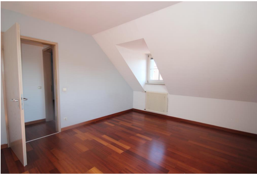
Büro oder Kind