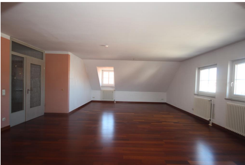
Wohnen u. Essen in schöner Größe