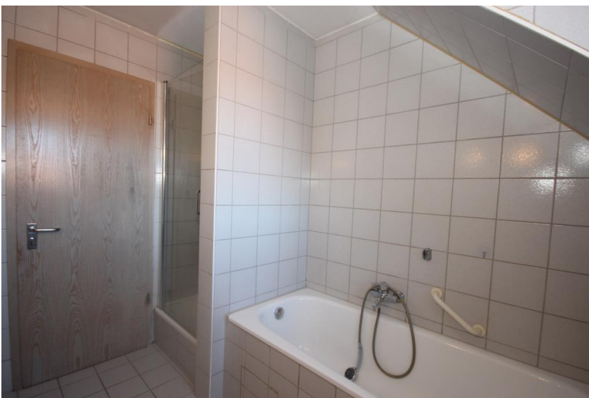
Wanne und Dusche