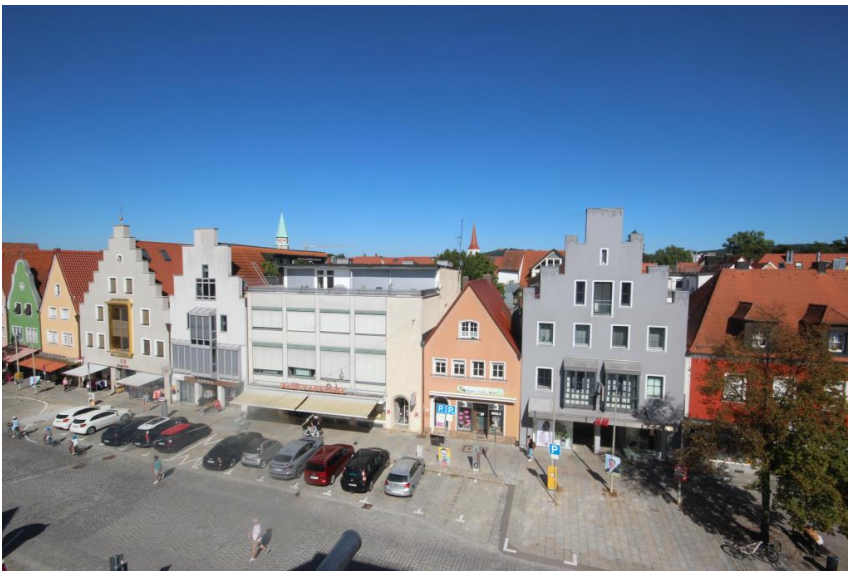
Über den Dächern