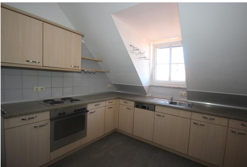
EBK günstig auf Wunsch