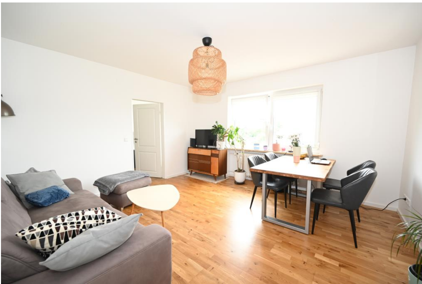
Wohnen mit Parkett