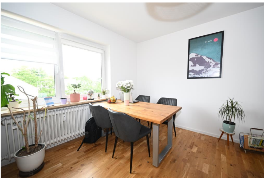
Essplatz für Vier