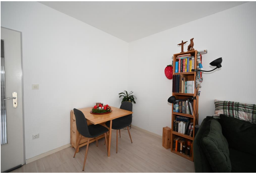
Platz für Esstisch