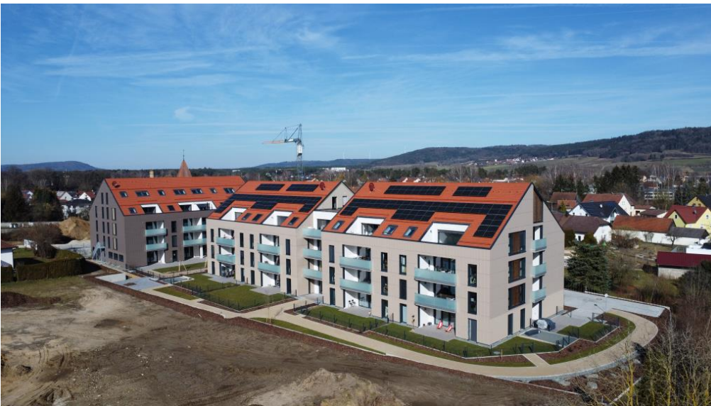
Ruhige, zentrale Lage