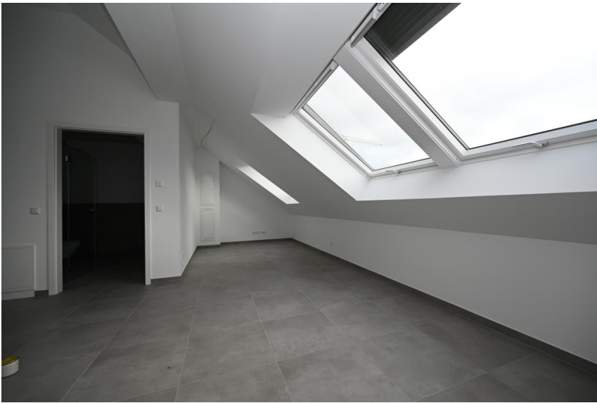
Lichtdurchflutet & modern