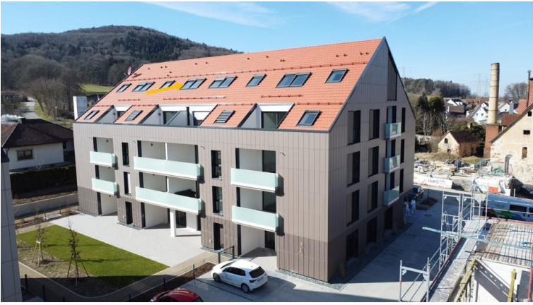
Ganz oben wohnen