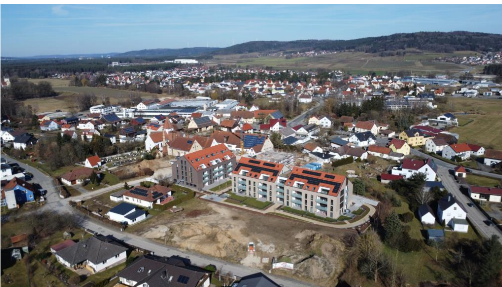
Mitten in Mühlhausen