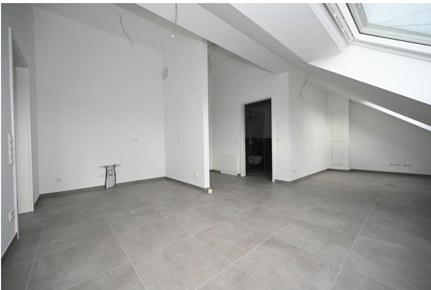
Toller Flair durch hohe Decken