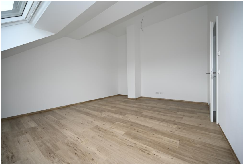
...mit viel Platz