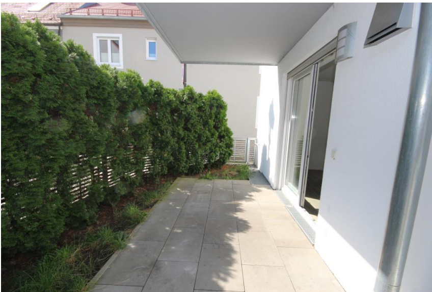
Geschützte Terrasse in schöner Größe