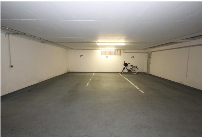
Stellplatz auf Wunsch