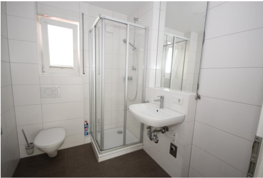
Duschbad mit Fenster