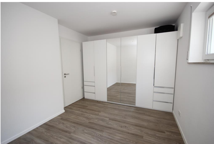
Schrank auf Wunsch