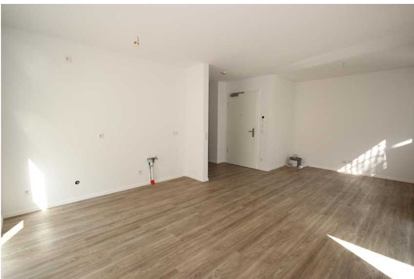
Küche mit Essplatz