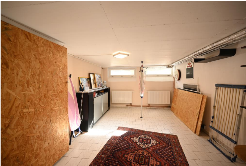
Raum in Wohnqualität