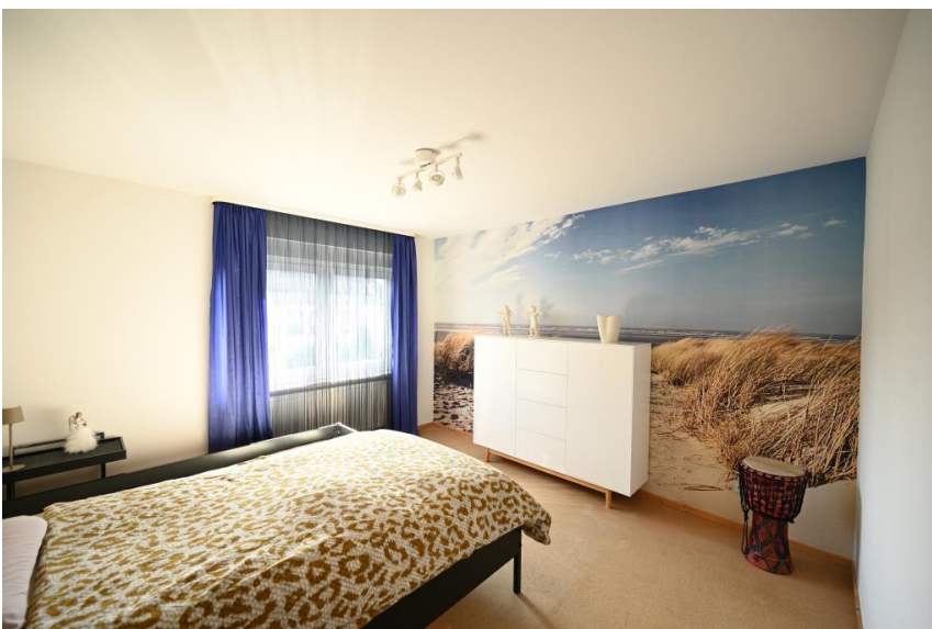
Schlafzimmer mit Blick in den Garten