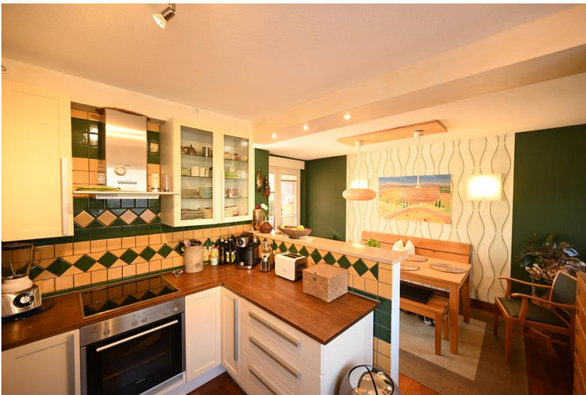
Küche: Rückzug und Offenheit zugleich