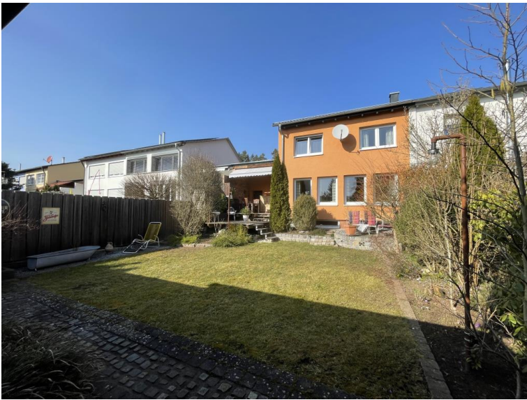
Sehr schöner Garten in perfekter Ausrichtung