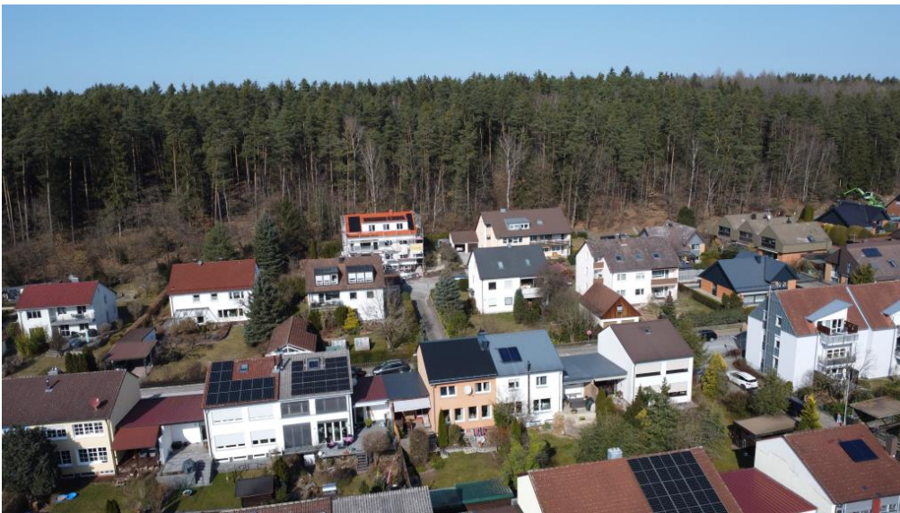
Naturnah und mit guter Infrastruktur