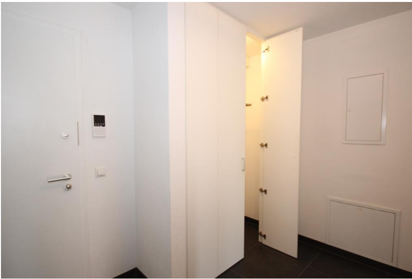
Windfang mit Einbauschränk