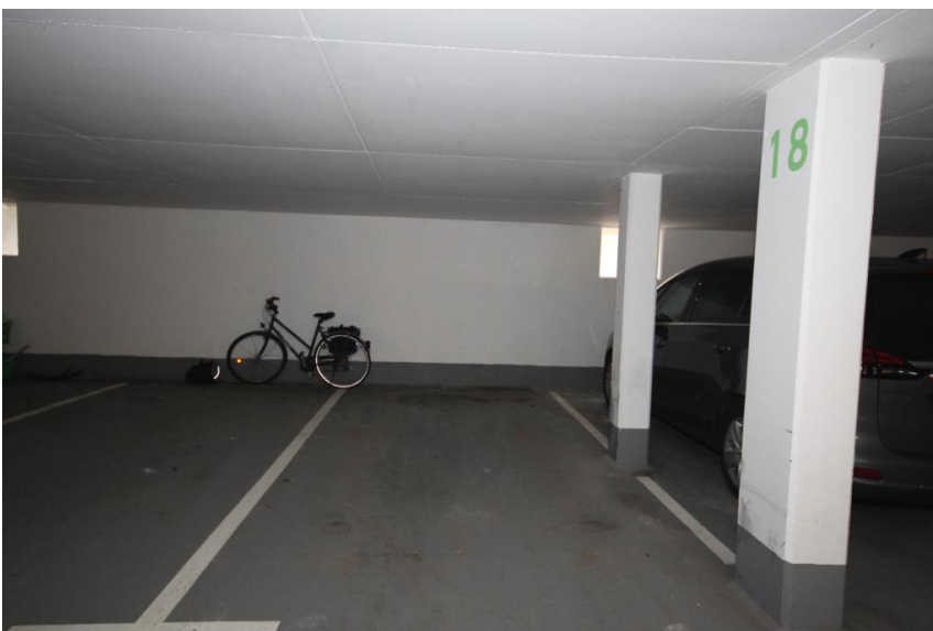
TG-Platz auf Wunsch