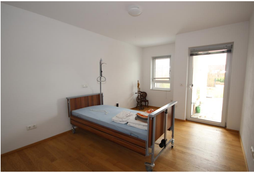
Schlafen mit Terrassenausgang