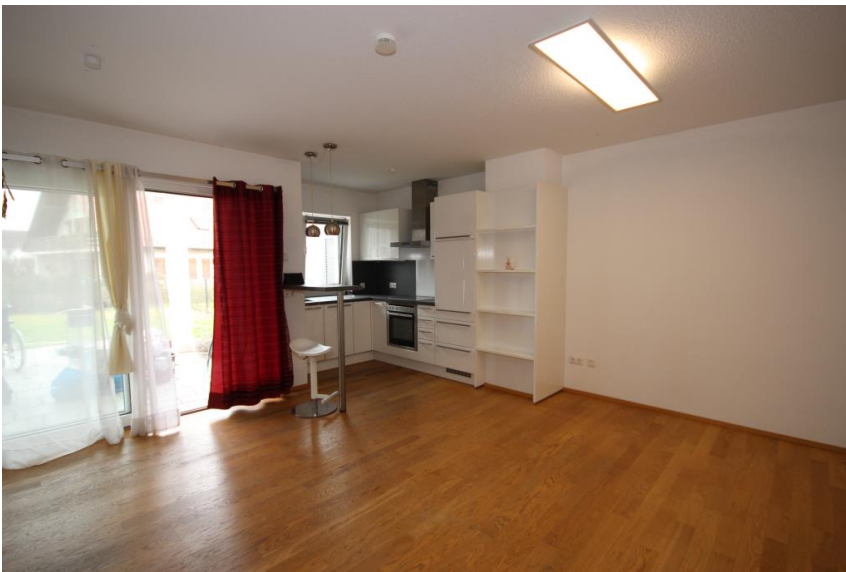
Offenes Wohnen mit Küche