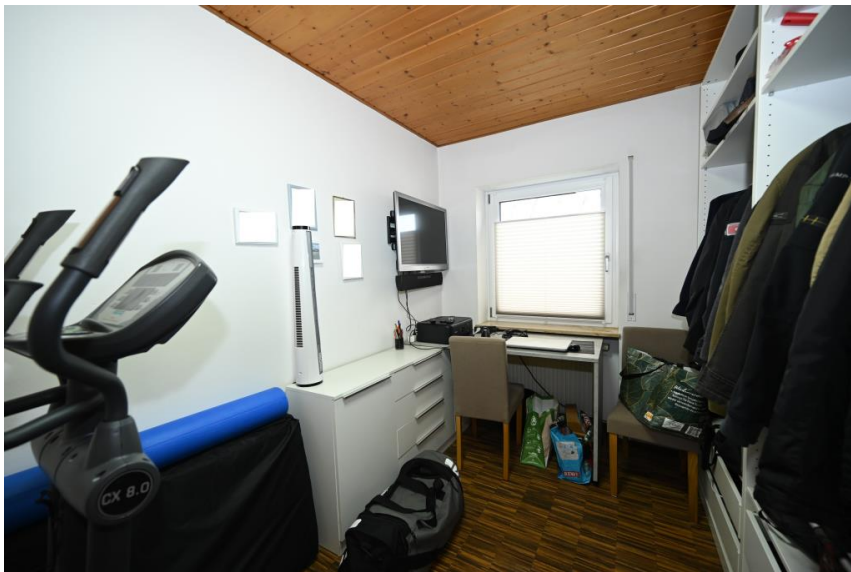
Büro / Gäste