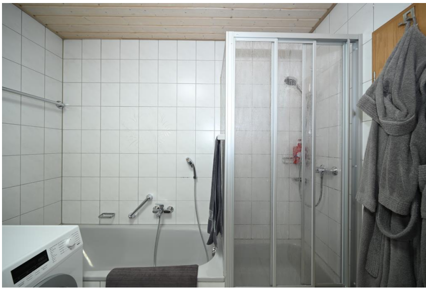
Wanne & Dusche