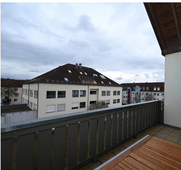
Über den Dächern