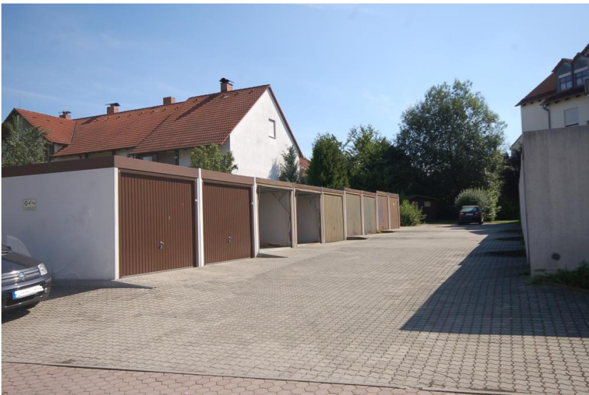
Garage auf Wunsch