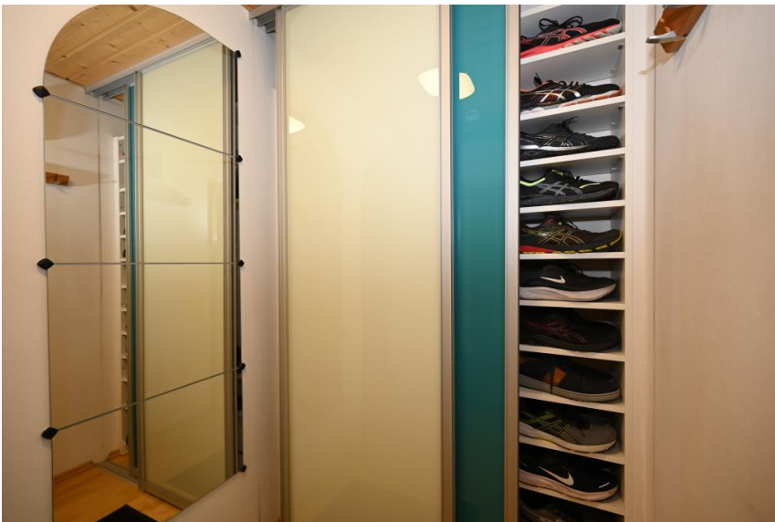
Praktisch - alles verräumt