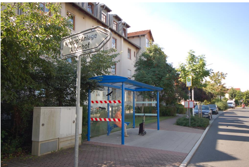
Stadtbus vor der Türe