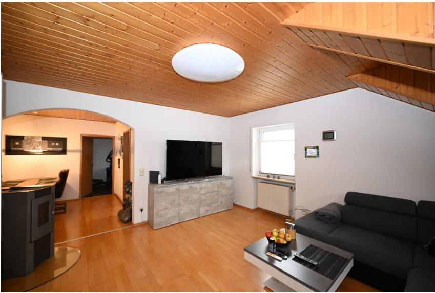
Platz für große Möbel