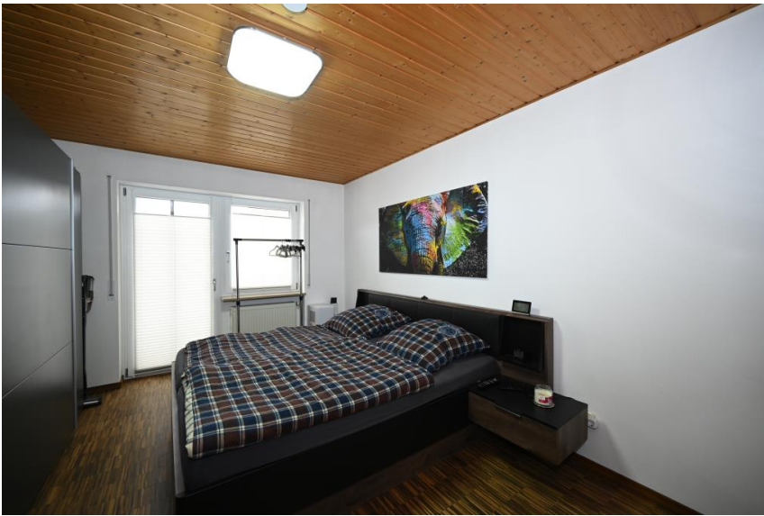
Schlafen mit Balkonausgang