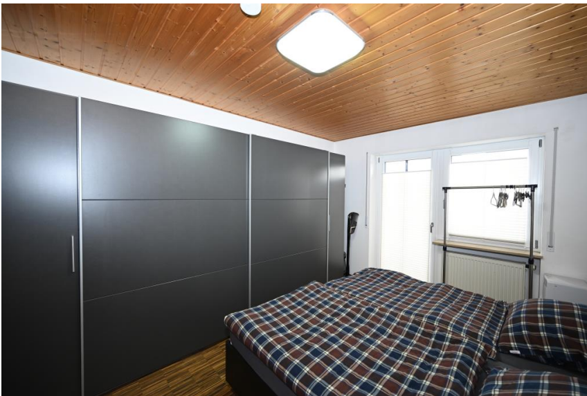
Großer Schrank - kein Problem