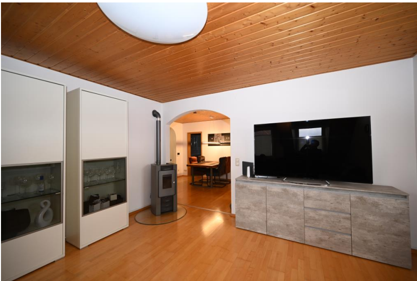
Alles an seinem Platz