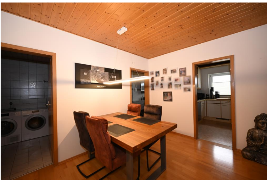
Essdiele bietet Platz