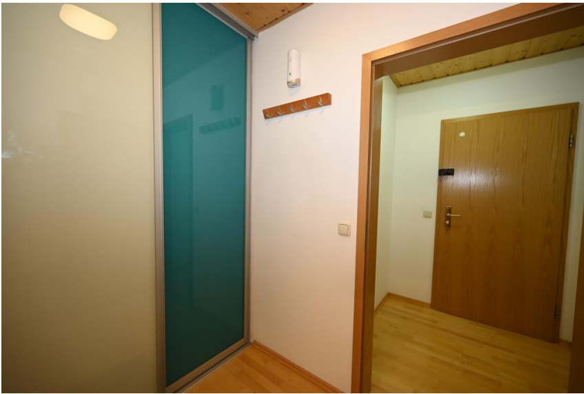
Vorraum mit Garderobe