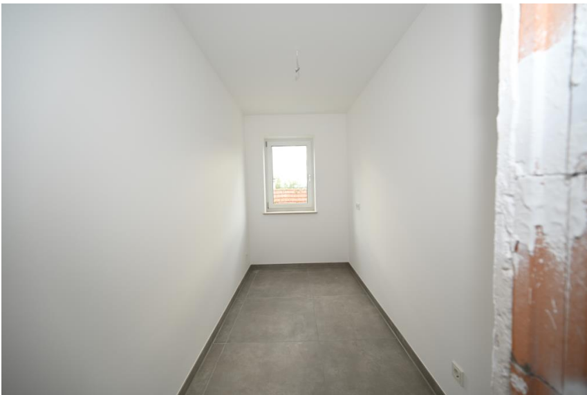
Hauswirtschaft + Lager