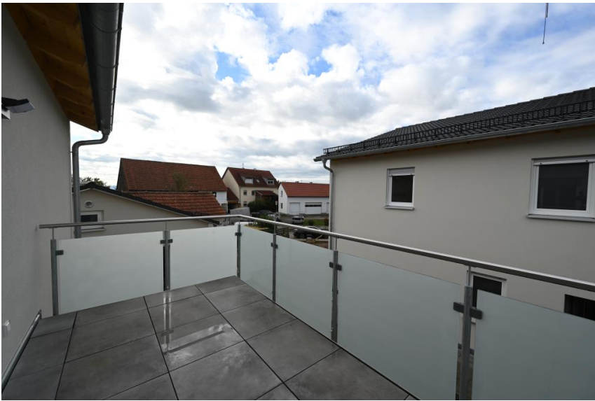
Balkon nach Südwest