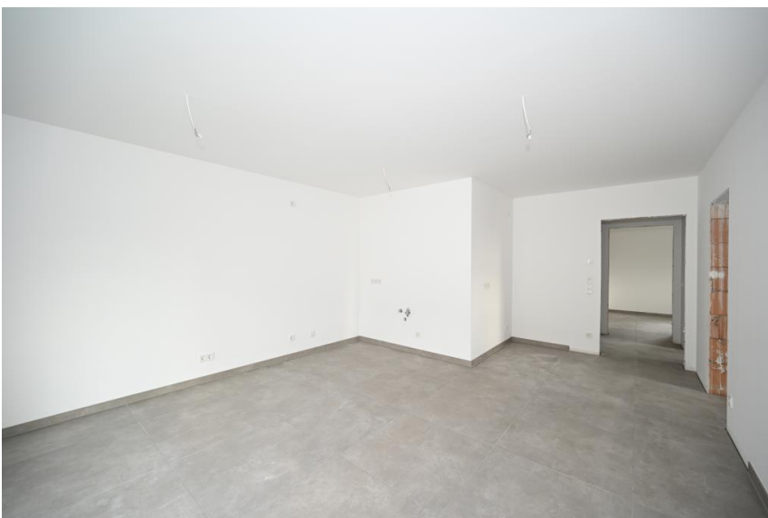
Alles in einem Raum