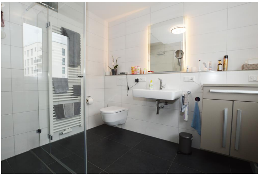
...Zugang zum Bad