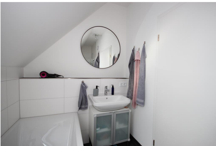
Bad in Vollausstattung