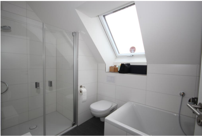
Wanne + Dusche + FBH