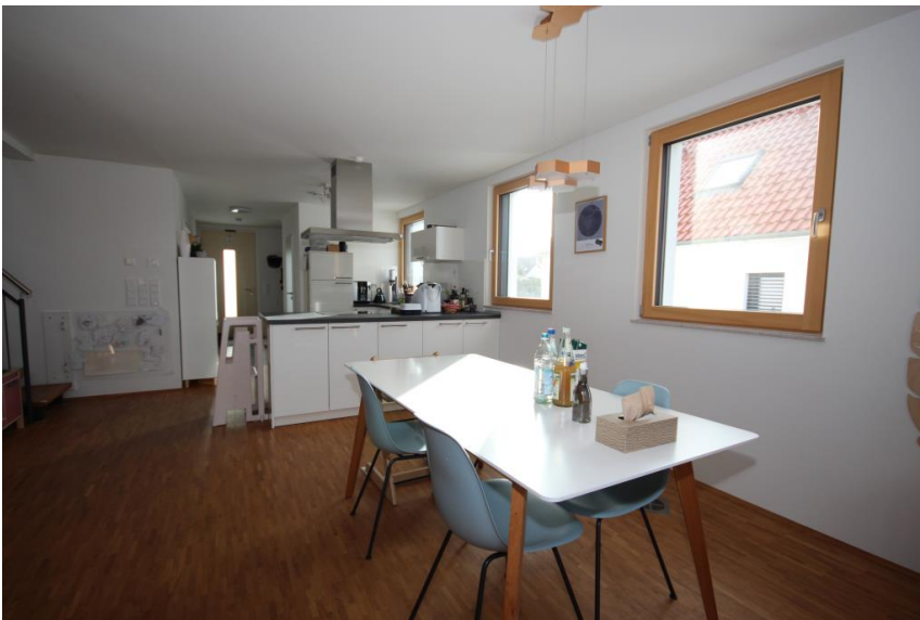
Offenes Wohnen & Essen