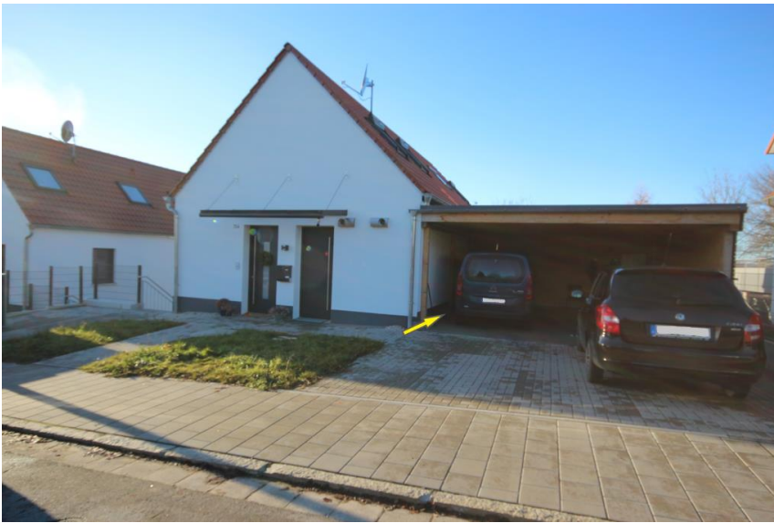
Parken im Carport inkl.