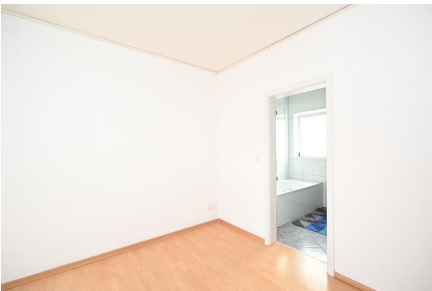
Zugang zum Bad