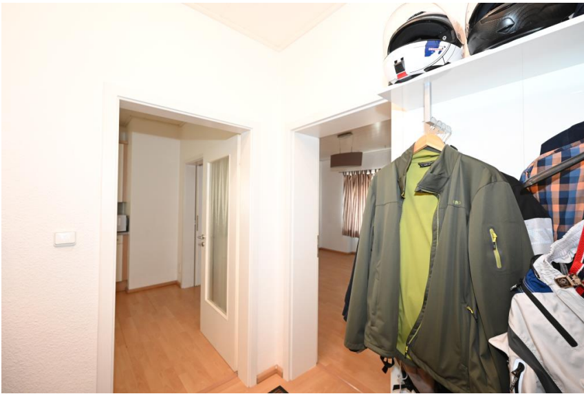
Eingang mit Garderobe