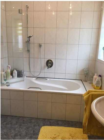
Wanne mit Duschkonfiguration