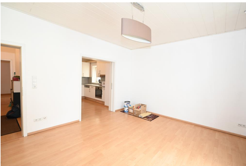
Durchgang zum Wohnzimmer