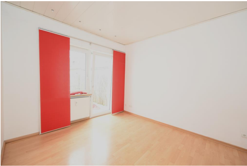
Schlafen mit Terrasse